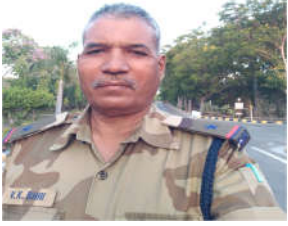
કમલમ દૈનિક, અરવલ્લી