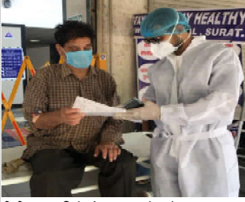
શિવિલાતા તબીબી અંગત સ્વચ્છ હોવાનો સુખદ અનુભવ થયો છે : કોરોનામુક્ત પ્રિવેન્શનમાં બેઠી