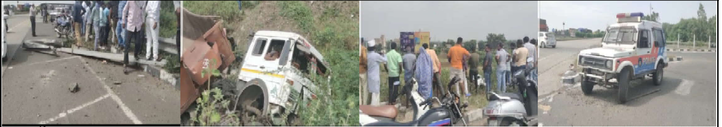
કમલમ દેનિક, મુખ્યમંત્રી ઉડીસા દાહોદ ઈન્દોર હાઈવે પર થી ટાઈલસ બંધી જતા સમયે દાહોદ ચોકડી પર ટૂંક ના સામે કાર આવી જતા કાર અકસ્માત થી બચાવવા જતા ટૂંક ચાલકે દાહોદ ચોકડી પર બનેલ ડિવાઈડર પર ચઢાવી હાથવે ની સાઈટ માં ખાસ માં ટૂંક ને ખામકી દીધી જેમાં ટૂંક અને ટૂંક માં ભરેલ ટાઈલસ નો મોટા પ્રમાણ માં નુકસાન થવા પામ્યું હતું. અકસ્માત થતાજ અજાણ્યે કાર ચાલક નાસી ગયો હતો જોત જોતા માં લોક તોડા ઉમટી પડ્યા અને દાહોદ ગ્રામ્ય પોલીસ ને જાણ કરવામાં આવી ઘટના ની જાણ થતાજ પોલીસ નામક ટોળ દોડી આવી જે ઈજા પ્રસ્ત ટૂંક ચાલક ને ૧૦૮ મારફતે સરકારી દવાખાના માં ખસેડી વધુ તપાસ હાથ ધરી