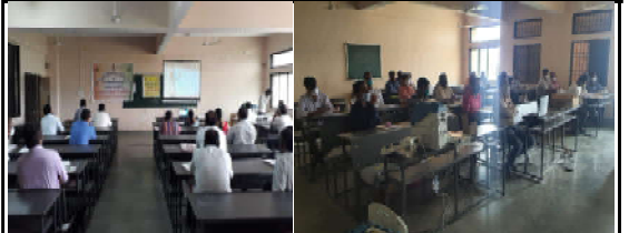
કમલમ દેવિક, વલસાડ જિલ્લાના ૧૮૧-કપરાડા (અ.જ.જા) બેઠકની પેટા ચૂંટણી -૨૦૨૦ અંતર્ગત તા.૩૧/૧/૨૦૨૦ના રોજ મતદાન યોજાવા છે. આ ચૂંટણી ન્યાયી, નિષ્પક્ષ રીતે યોજાય તે હેતુ મતદાન દિવસે મતદાનની પ્રક્રિયા માટે પ્રિસાઈડિંગ ઓફિસરોની કામગીરી અંગેની તાલીમ યોજાઈ હતી. આ તાલીમમાં ચૂંટણી પ્રક્રિયા દરમિયાન મતદાનના દિવસે કરવાની થતી કામગીરીની જાણકારી આપવાની સાથે તેઓને મૂંઝવતા પ્રશ્નોનો નિરાકરણ કરવામાં આવ્યું હતું.