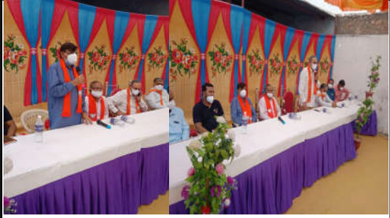
કમલમ દેનિક, આ પ્રવાસ દરમિયાન મોરબી જિલ્લાના આગેવાનો, મંડળ પ્રતિનિધિઓ, ભારતીય જનતા પાર્ટીના ચૂંટાયેલા જન પ્રતિનિધિઓ, હોદ્દાદારો, સ્થાનિક મંડલના આગેવાનો તેમજ શક્તિકેન્દ્રના ઈન્ચાર્જો, કાર્યકર્તાઓ તથા ગ્રામજનો હાજર રહ્યા.