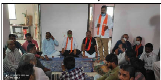
અબકાસા તાલુકા પ્રવાસ ડાર્જિલ હરમિયાન “તરેકી” ગામની મુલાકાત લીધી, પ્રવાસ દરમિયાન વિલ્લા આગેવાનો, મંડલ પ્રતિનિધિઓ, ભારતીય જનતા પાર્ટીના ચુંટાયેલા જન પ્રતિનિધિઓ, હોદ્દાઓ, સ્થાનિક મંડલા આગેવાનો તેમજ શક્તિદેવના ઇન્ચાર્જ, ડાર્જિલિંગ તથા ગામજન હાજર રહ્યાં. (સમત દેવિસ)