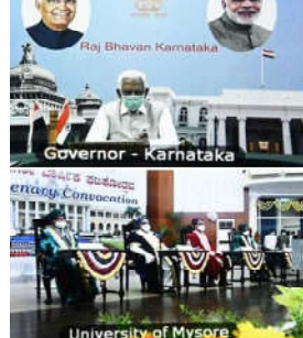
Raj Bhavan Karnataka Governor - Karnataka University of Mysore