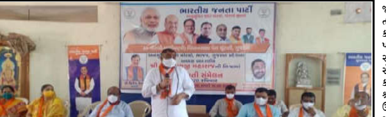
મોરબી-માલીયા(મી) વિધાનસભા પેટા ચૂંટણીને અંતર્ગત મોરબી જિલ્લા ભાજપ અનુચિત જાત મોરચા દ્વારા બેઠક યોજાઈ હતી. (કમલમ ઈલેક)