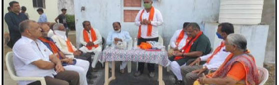
અબડાસા તાલુકા પ્રવાસ કાર્યક્રમ દરમિયાન 'સણોસરા' ગામની મુલાકાત લીધી, પ્રવાસ દરમિયાન જિલ્લા આગેવાનો, મંડળ પ્રતિનિધિઓ, ભારતીય જનતા પાર્ટીના ચૂંટાયેલા જન પ્રતિનિધિઓ, હોદ્દાશ્રીઓ, સ્થાનિક મંડળના આગેવાનો તેમજ શક્તિકેન્દ્રના ઈલ્કાઈઓ, કાર્યકર્તાઓ તથા ગ્રામજનો હાજર રહ્યા. (કમલમ ઈલેક)