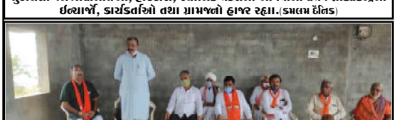
અબડાસા તાલુકા પ્રવાસ કાર્યક્રમ દરમિયાન 'બાલારોડ નાની' ગામની મુલાકાત લીધી, પ્રવાસ દરમિયાન જિલ્લા આગેવાનો, મંડળ પ્રતિનિધિઓ, ભારતીય જનતા પાર્ટીના ચૂંટાયેલા જન પ્રતિનિધિઓ, હોદ્દાશ્રીઓ, સ્થાનિક મંડળના આગેવાનો તેમજ શક્તિકેન્દ્રના ઈલ્કાઈઓ, કાર્યકર્તાઓ તથા ગ્રામજનો હાજર રહ્યા. (કમલમ ઈલેક)