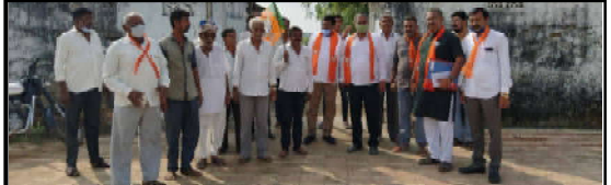
અબડાસા તાલુકા પ્રવાસ કાર્યક્રમ દરમિયાન 'નાદ્દા' ગામની મુલાકાત લીધી, પ્રવાસ દરમિયાન જિલ્લા આગેવાનો, મંડળ પ્રતિનિધિઓ, ભારતીય જનતા પાર્ટીના ચૂંટાયેલા જન પ્રતિનિધિઓ, હોદ્દાશ્રીઓ, સ્થાનિક મંડળના આગેવાનો તેમજ શક્તિકેન્દ્રના ઈલ્કાઈઓ, કાર્યકર્તાઓ તથા ગ્રામજનો હાજર રહ્યા. (કમલમ ઈલેક)