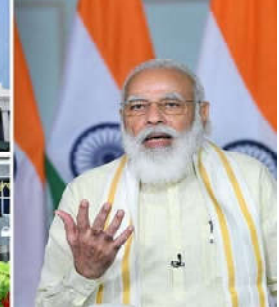
મહાદિન નથી, પણ સાથે સાથે આ આઈઆઈએમ અને ઈ એમ્સ સ્થાપિત થઈ છે. અથવા એનું નિર્માણ થઈ રહ્યું છે. પ્રધાનમંત્રીએ કહ્યું હતું કે, છેલ્લા પાંચથી છ વર્ષમાં ઉચ્ચ શિક્ષણમાં સરકારના પ્રયાસો નવી સંસ્થાઓ ખોલવા પૂરતાં

આપવામાં આવી છે. જેથી તેઓ તેમની જરૂરિયાત મુજબ નિર્ણય લઈ શકે. તેમણે કહ્યું હતું કે, પ્રથમ આઈઆઈએમ ધારા દેશભરમાં આઈઆઈએમ સંસ્થાઓને વધારે અધિકાર આપતો હતો. તબીબી શિક્ષણમાં વધારે પારદર્શિતા લાવવા માટે રાષ્ટ્રીય તબીબી યંત્ર ઊભું કરવામાં આવ્યું છે. હોમિયોપેથી અને અન્ય ભારતીય તબીબી પદ્ધતિઓમાં સુધારો લાવવા માટે બે નવા કાયદા પણ બનાવવામાં આવ્યાં છે. જરૂર છે. પ્રધાનમંત્રી સોદીએ મેસૂર વિશ્વવિદ્યાલયને દેશમાં શ્રેષ્ઠ શૈક્ષણિક સંસ્થાઓ પૈકીની એક સંસ્થા હોવાની સાથે વિશ્વવિદ્યાલયના સંચાલકોને નવી ઊભી થતી સ્થિતિને અનુરૂપ