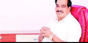
કોર્પોરેટર ડેવારા સાબિત કરી આપે ઈડું માટે સાંકળવણ કરેલા તેઓ હવે અલ્લાયા આક્રોષી કરતાર જહેર ઊભા અને સંપર્કારણ છે. - શ્રી સી. આર. પાટીલ

ભાજપાના પ્રદેશ અધ્યક્ષ શ્રી સી.આર. પાટીલનો અબડાસા વિધાનસભા સીટ અંતર્ગત ચૂંટણી પ્રવાસ યોજાયો