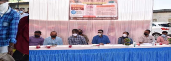
કમલમ દૈનિક, લુણાવાડા, મહામારી વચ્ચે પણ જિલ્લાના કોરોનાવાયરસની વૈશ્વિક એનેમીક સગભા મહિલાઓને