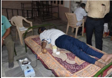
કમલમ દૈનિક, લુણાવાડા, મહામારી વચ્ચે પણ જિલ્લાના કોરોનાવાયરસની વૈશ્વિક એનેમીક સગભા મહિલાઓને

કોરોના સંદર્ભેની તકેદારી સાથે રક્તદાન કેમ્પોમાં ૧૭૯૭ યુનિટ બ્લડ ડોનેશન થયું