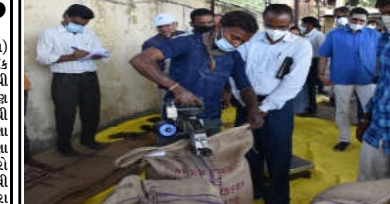
કમલમ દૈનિક, લુણાવાડા, મહામારી વચ્ચે પણ જિલ્લાના કોરોનાવાયરસની વૈશ્વિક એનેમીક સગભા મહિલાઓને