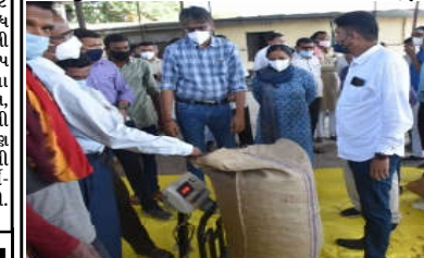
કમલમ દૈનિક, લુણાવાડા, મહામારી વચ્ચે પણ જિલ્લાના કોરોનાવાયરસની વૈશ્વિક એનેમીક સગભા મહિલાઓને