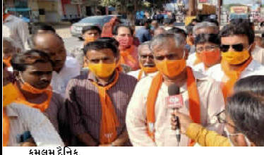
કમલમ દેનિક, નખરાણા ખાતે door to door પ્રચાર કર્યો જેમાં લોકોના પ્રતિસાર સાંભળી ખુબ જ ઉત્સાહિત છીએ. નખરાણા-લખપત-અબડાસા ની જનતા નો ખુબ ખુબ આભાર...