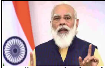
કમલમ દેનિક, ભારતે હિતમત્તવક વૈશ્વિક મહામારી સામે લડાઈ આપી, આખી દુનિયાએ ભારતની રાષ્ટ્રીય લાક્ષણિકતા જોઈ. દુનિયાએ ભારતની ખરી શક્તિઓ પણ જોઈ. ભારતીયો જેના માટે જાણીતો છે તે

મહામારીમાં નાંધપાત્ર સહનશીલતા દર્શાવી છે. આ સહનશીલતા અમારી પ્રજાશ્રીઓની શક્તિ, અમારા લોકોના સહકાર અને અમારી નીતિઓની સ્થિરતાથી ચાલે છે. અમારી પ્રજાશ્રીઓની શક્તિના કારણે જ, અમે અંદાજે ૮૦૦ મિલિયન લોકોને ખાદ્યાર પૂરું પાડી શક્યા, ૪૨૦ મિલિયન લોકોને નાણાં પહોંચાડી શક્યા અને અંદાજે ૮૦ મિલિયન પરિવરોને વિનામુલ્ય રોંધણગેસ પુરો પાડી શક્યા. અમારા લોકો કે જેમણે સામાજિક અંતરનું આવરણ કમું અને માસ્ક પહેરવાની આદત કેળવી તેમના સહકારના કારણે જ ભારતે આ વચરસ સામે આટલી સફળતા લડાઈ આપી છે. અમારી નીતિઓની સ્થિરતાના કારણે જ ભારત દુનિયામાં સૌથી પ્રાધાન્યતા