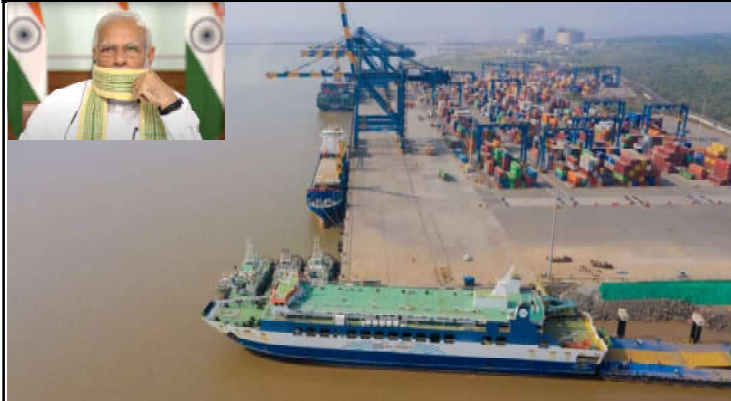
નોડરીઓ અને ઉઘોગો માટે નવા કોશ્ચોનું સર્જન થશે અને આ પ્રદેશમાં પર્યટનને વેગ મળશે

કમલમ દૈનિક, પ્રધાનમંત્રી શ્રી નરેન્દ્ર મોદી ૮ નવેમ્બર ૨૦૨૦ના રોજ સવારે ૧૧ વાગ્યે વિડિયો કોન્ફરન્સિંગના માધ્યમથી ગુજરાતમાં હજુરા ખાતે રો-પેક્સ ટર્મિનલનું ઉદ્ઘાટન કરશે અને હજુરાથી ઘોઘા વચ્ચે રો-પેક્સ ફેરી સેવાને લીલીઝંકી બતાવી તેનો શુભારંભ કરાવશે. જળમાર્ગોનો ઉપયોગ કરવાની અને તેમને દેશના આર્થિક વિકાસ સાથે સંકલિત કરવાની પ્રધાનમંત્રીની દૂરદેશીની દિશામાં આ કાર્યક્રમ એક મોટું