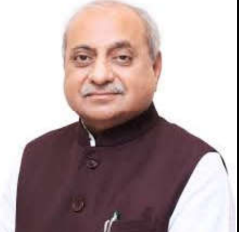
ઉપલબ્ધીઓ માટે રાજ્યપાલ આચાર્ય દેવવ્રત અને મુખ્યમંત્રી વિજય ભાઈ રૂપાણી દ્વારા પાલકાયેલા શુભેચ્છા સંદેશનું પઠન કરવામાં આચાર્ય હતા. નાયબ મુખ્યમંત્રીએ આ પ્રસંગે રેડકોસ