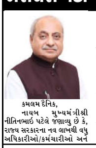
કમલમ દૈનિક, નાયબ મુખ્યમંત્રીશ્રી નીતિનભાઈ પટેલે જણાવ્યું છે કે, રાજ્ય સરકારના તબ લાખથી વધુ અધિકારી/કર્મચારીઓ અને