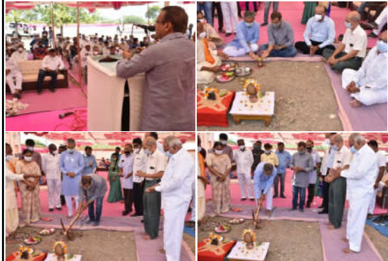
કમલમ દૈનિક, જૂનાગઢ માણવદર તાલુકાના ભાદરકાંઠાના ૨૬ અને કૃતિયાણા તાલુકાના ચોટા પછીના ૧૩ એમ કુલ ૩૯ ગામ માટે રૂ.૨૨.૪૧ કરોડના ખર્ચે સાકાર થયાર ભાદર-