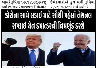
કમલમ દેનિક, વાંશિગંજ, અમેરિકાના રાષ્ટ્રપતિ પદની ચુંટણી જીતનાર જો બિરોને ૨૦ જાન્યુઆરીએ શપથ લેનાર છે. ત્યારે અત્યારે એક સલાહ બંધાવે રહી રહ્યો છે કે રાષ્ટ્રપતિનો કાર્યભાર સંભાળવા બાદ જો બિરોને સૌથી પહેલું કામ શું કરશે? આ સલાહનો જવાબ છે કોરોના સામેની લડાઈ. તેઓ રાષ્ટ્રપતિ પદ પર આવવાની સાથે જ કોરોના સામેની લડાઈને નવી દિશા આપશે. કચ્છ કે કોરોના વાયરસથી અમેરિકા સૌથી વધારે પીડિત છે. અમેરિકામાં ત્યાર સુધીમાં કોરોના વાયરસના ૧૨.૮૮ કરોડ કરતા વધુ પેશન્ટો દર્દીઓ સામે આપ્યાં છે. તે કોરોનાના ૧૧૨.૪૮ લાખ લોકોના મોત પહેલાં છે. આ બધું થવા છતાં કોરોના ટ્રુપે ના તો પોતે મારક પહેલું કે ના તો લોકો મારકે રજીવવાઈ શક્યું. જેના કારણે દેશના લોકો તો કોરોનાનો ભોગ બન્યા, પરંતુ સામે રાષ્ટ્રપતિ ટ્રુપે પણ કોરોનાનો ભોગ બન્યા. ત્યારે દરેક અમેરિકામાં નવા રાષ્ટ્રપતિ જો બિરોને કહું કે પદભાર ગ્રહણ કર્યા બાદ તરત જ તો આખા દેશમાં માર્કને રજીવવાઈ કરશે. જે માટે તેમને દરેક રાજ્યના ગવર્નર સાથે વાત કરશે. જો બિરોને કહું કે તેઓ કોરોના સામે લડાઈ તો મેયરો સાથે વાત કરશે. આ સિવાય પાનડેસિક ડિરેંચ બોર્ડ પણ બનાવવા, જેના માટે બિરોને એક ટીમનું એલાન પણ કર્યું છે. જેમાં ભારતવંતી મૂર્તિ પણ સામેલ છે. એવી શક્યતા પણ રહેલી છે કે બિરોને પદભાર ગ્રહણ કરે તેના એક દિવસ પહેલાં પારિસ સમજૂતિમાં અમેરિકાની વાપસી માટે સંયુક્ત રાષ્ટ્રને પણ લખવામાં આવશે.

૩૦,૮૦ લાખ સુધીનાં ખર્ચ કરી શકે તેવી ચુંટણી પંચની જોગવાઈ છે. જેમાં દરેક ઉમેદવારોએ અર્થના હિસાબે ચુંટણી વિભાગ સમક્ષ રજૂ કર્યા હતા. લીબડી વિધાનસભા પેટા ચુંટણીમાં સૌથી વધુ ખર્ચ કોંગ્રેસના ઉમેદવાર ચેતનભાઈ ઉમેદવારે રૂપિયા ૧૭,૧૮,૩૮૯ રજૂ કર્યો છે. જ્યારે ભાજપના ઉમેદવાર