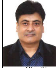
કમલમ દેનિક, ગાંધીધામ, ગુજરાત સ્ટેટ ટેબલ ટેનિસ એસોસિયેશનના (જીએસટીએ) એ શ્રી વિપુલ મિત્રા (આઈએએસ)ને આગામી ચાર વર્ષની ટર્મ માટે ફરીથી ચુંટી કાઢવા છે. આ ટર્મ ૨૦૨૦થી ૨૦૨૪ સુધીની રહેશે. આઠમી નવેમ્બર ને રવિવારે જીએસટીએની વાર્ષિક સામાન્ય

વચ્ચુઅલ પ્લેટફોર્મ પર ચોખ્ખેલી એજુએમમાં તોરાવાણે અને સંગતાણી ચેરમેન અને સેક્રેટરી તરીકે જારી રહ્યા