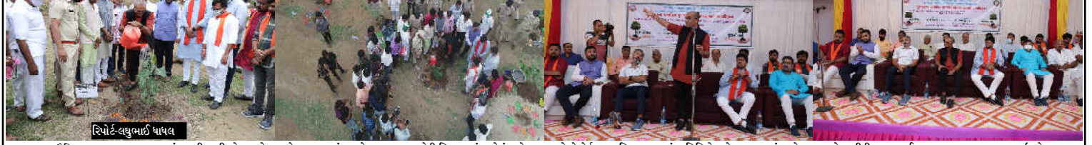
ક્રમવત્કેનિક

મુખ્યમંત્રી રૂપાણીના ૬૫ માં જન્મદિવસ નિમિત્તે સુરેન્દ્રનગર જિલ્લાના ચોટીલા યામુંડા યુવા મુખ દ્વારા સમગ્ર તાલુકામાં કુલ ૬૫ હજાર વૃક્ષોના વાવેતર થકી જન્મદિવસની અનોખી ઉજવણી કરવામાં આવી હતી.