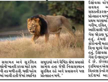
માટે સુરક્ષિત રહેવાનો ખાતરી કરવા માટે કામ કરવાની તક મળી હતી. ઘણી હાલ કરવામાં આવી હતી જેમાં સ્થાનિક

કેન્દ્રો દરમિયાન સાત કરવા માટે આગળ ધપી રહ્યો છે. આપણે આગમી ૨૫ વર્ષમાં આ સંવલિત વિકાસને પૂર્ણ કરવાનો છે. આપણે સાથે મળીને સક્ષમ ભારતના સંકલ્પને સિદ્ધ કરવાનો છે. આ કાર્યમાં બહેનો વિશેષ ભૂમિકા અદા કરવા જઈ રહી છે.