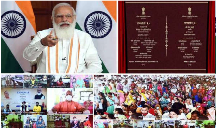
હાર્ડસિંગ, પિચ્છી, પાણી, શોચાલય, ગેસ, માર્ગ, હોસ્પિટલ અને શાળાઓ જેવી મૂળભૂત સુવિધાઓ અને દાયકાઓ અગાઉ દેશન આપી શકાયું હોત : પ્રધાનમંત્રી

કમલ દૈનિક, પ્રધાનમંત્રી શ્રી નરેન્દ્ર મોદીએ આજે એક વીડિયો કોન્ફરન્સ મારફતે મહોબા ઉત્તર પ્રદેશ ખાતે એલપીજી જોડાણ વિતરણ કરીને ઉજ્જવલા ૨.૦ યોજના (પ્રધાનમંત્રી ઉજ્જવલા યોજના - PMUY) લોન્ચ કરી હતી. આ પ્રસંગે પ્રધાનમંત્રીએ