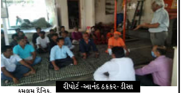
કમલમ્ દૈનિક, રીપોર્ટ -આનંદ દેક્કર-ડીસા

પ્રધાનમંત્રીનો પ્રોજેક્ટ લાયન વિઝન માટે આભાર વ્યક્ત કર્યો. વનકર્મીઓ સહિત રીવેટેડ સૌનો આભાર માન્યો. સિંહને રાષ્ટ્રીય પ્રાણી ઘોષિત કરવાની માંગ કરી છે દરેક વખતે તેઓના વહેરા ઉપર તથા શબ્દો રૂપે એક અનન્ય લાગણી નીતરતી હતી એક અંગભી ભાવ દર્શાતી હતી તે અનોખી ખુમારી-આત્મીયાના અને અનુસંધાન વ્યક્ત કરતા