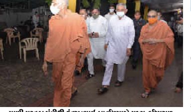
પાણી પુરવા કમલમહેનિક