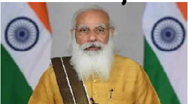
પ્રધાનમંત્રીએ વેક્સિનેશન સંગે જાગૃતિ ફેલાવવા તથા વેક્સિન સામેના અપરાધોને દૂર કરવા સરકાર સાથે મળીને કાર્ય કરવા અગ્રણીઓને પ્રોત્સાહિત કર્યા

પ્રધાનમંત્રીએ કોવિડ-૧૯ સંગે ધાર્મિક અને સામાજિક સંરચાઓના પ્રતિનિધિઓ સાથે વાણીજીત કરી કમલમહેનિક