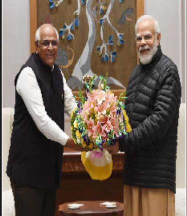
કમલમ્ ન્યૂઝ, નવી દિલ્હી ખાતે દેશના યશસ્વી વડાપ્રધાન તથા વૈશિક નેતા શ્રી નરેન્દ્રભાઈ મોદી સાહેબ સાથે રાજ્યના યશસ્વી મુખ્યમંત્રી શ્રી ભૂપેન્દ્રભાઈ પટેલ સાહેબે મુલાકાત કરી આગામી વિકાસવહી આયોજનો અંગે માર્ગદર્શન પ્રદાન કર્યું હતું. આદરણીય વડાપ્રધાનશ્રીએ મહેલ વિશ્વાસ થકી રાજ્યનો સર્વોચ્ચ વિકાસ કરવા કટિબંધ છીએ તેવો દ્રઢ વિશ્વાસ તેઓશ્રીએ વ્યક્ત કર્યો હતો.