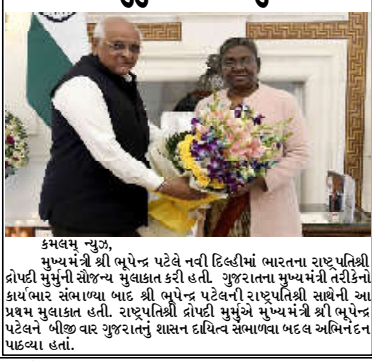
કમલમ્ ન્યૂઝ, મુખ્યમંત્રી શ્રી ભૂપેન્દ્ર પટેલે નવી દિલ્હીમાં ભારતના રાષ્ટ્રપતિશ્રી દ્રોપદી મુર્મુની સૌજન્ય મુલાકાત કરી હતી. ગુજરાતના મુખ્યમંત્રી તરીકેનો કાર્યભાર સંભાળ્યા બાદ શ્રી ભૂપેન્દ્ર પટેલની રાષ્ટ્રપતિશ્રી સાથેની આ પ્રથમ મુલાકાત હતી. રાષ્ટ્રપતિશ્રી દ્રોપદી મુર્મુએ મુખ્યમંત્રી શ્રી ભૂપેન્દ્ર પટેલને બીજા વાર ગુજરાતનું શાસન દાવિત્વ સંભાળવા બદલ અભિનંદન પાઠવ્યા હતાં.