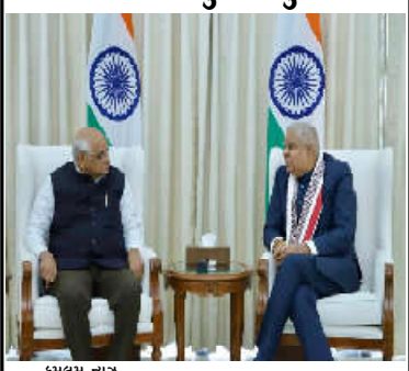
કમલમ્ ન્યૂઝ, ગુજરાતના મુખ્યમંત્રી તરીકેનો કાર્યભાર સંભાળ્યા બાદ શ્રી ભૂપેન્દ્ર પટેલે ઉપરાષ્ટ્રપતિ શ્રી જાદેવ ધનપાડ સાથે પ્રથમ શુભેચ્છા મુલાકાત દિલ્હી ખાતે કરી હતી. મુખ્યમંત્રી શ્રી ભૂપેન્દ્ર પટેલે તેમના એક દિવસીય દિલ્હી પ્રવાસ દરમિયાન ભારતના ઉપરાષ્ટ્રપતિ શ્રી જાદેવ ધનપાડની આ શુભેચ્છા મુલાકાત કરી હતી. ઉપરાષ્ટ્રપતિ શ્રી જાદેવ ધનપાડે શ્રી ભૂપેન્દ્ર પટેલને સતત બીજાવાર ગુજરાતના મુખ્યમંત્રી તરીકેની જવાબદારી સંભાળવા બદલ અભિનંદન આપી શુભેચ્છાઓ પાઠવી હતી.