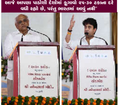
આજે આપણા પાડોશી દેશોમાં કુગાળો રૂપ-૩૦ ટકાના દરે વધી રહ્યો છે, પરંતુ ભારતમાં આંપું નથી"

"નવ-મધ્યમ વર્ગ અને મધ્યમ વર્ગ બંને સરકારની પ્રાથમિકતા છે"