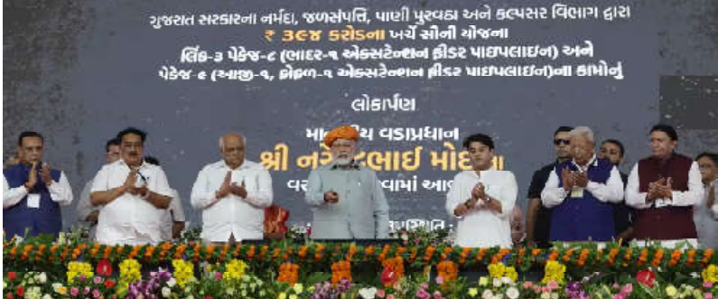
ગુજરાત સરકારના નર્મદા, જળસંપત્તિ, પાણી પુરવઠા અને કલ્પસર વિભાગ દ્વારા રૂ ૩૬૪ કરોડના ખર્ચે સોની યોજના વિંચ-૩ પેકેજ-૮ (લાઇટ-૧ એક્સટેન્શન ફીડર પાઇપલાઇન) અને પેકેજ-૯ (લાઇટ-૧, ડ્રોઇંગ-૧ એક્સટેન્શન ફીડર પાઇપલાઇન)ના કામોનું લોકાર્પણ