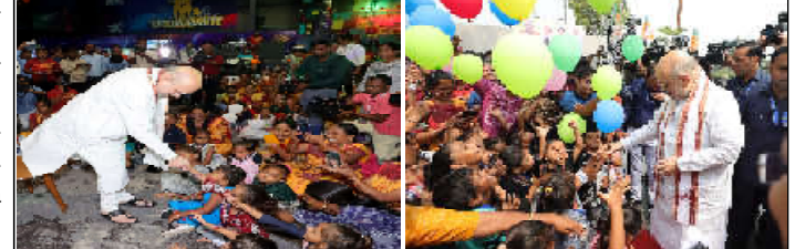
આ માટે તેમને સાઈકલ શિબિર, પોષણલુચ્કત આહાર આપવાની સાથે તેમની વચ્ચે રમકડાંનું વિતરણ કરવા અને તેમને ગેમિંગ ગ્રોહમાં લઈ જઈને તેમનું મનોરંજન કરવા માટે સતત પ્રયત્નો કરવામાં આવી રહ્યા છે

એક સાંસદ તરીકે મારો એ પ્રયાસ છે કે મારા લોકસભા મતવિસ્તારમાં આંગણવાડી કેન્દ્રોના બાળકોને સમૃદ્ધ પરિવારોના બાળકોને મળતી તમામ શક્ય સુવિધાઓ અને પુશીઓ મળે