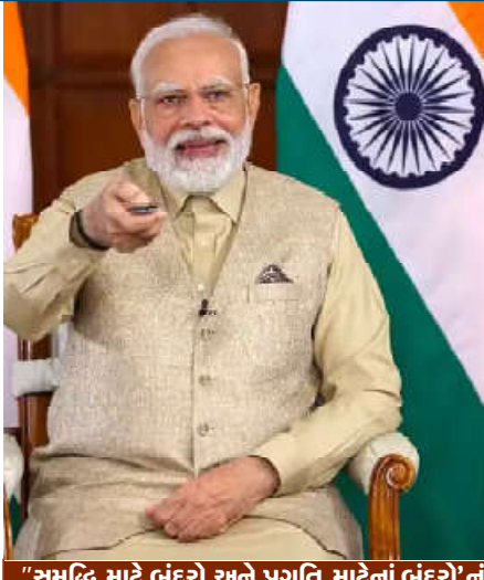
"સમૃદ્ધિ માટે બંદરો અને પ્રગતિ માટેનાં બંદરો"નું સરકારનું વિઝન જમીની સ્તરે પરિવર્તનકારી પરિવર્તન લાવી રહ્યું છે.

કમલમ ન્યૂઝ, પ્રધાનમંત્રી શ્રી નરેન્દ્ર મોદીએ મુંબઈમાં ગ્લોબલ મેરિટાઇમ ઈન્ડિયા સમિટ ૨૦૨૩ના ત્રીજા સંસ્કરણનું ઉદ્ઘાટન કર્યું હતું. આજે વીડિયો કોન્ફરન્સિંગ દ્વારા પ્રધાનમંત્રીએ 'અમૃત કાળ વિઝન ૨૦૪૭'નું અનાવરણ પણ કર્યું હતું, જે ભારતીય દરિયાઈ ભૂ ઇકોનોમી માટે ભૂખિંટ છે. આ ભવિષ્યલક્ષી યોજનાને અનુરૂપ પ્રધાનમંત્રીએ ૨૩,૦૦૦ કરોડથી વધારેના મૂલ્યનાં વિવિધ પ્રોજેક્ટ્સનું ઉદ્ઘાટન કર્યું હતું. રાષ્ટ્રને સમર્પિત કર્યાં અને શિલાન્યાસ કર્યાં હતાં અને દરિયાઈ ભૂ ઇકોનોમી માટે 'અમૃત કાળ વિઝન ૨૦૪૭' સાથે સુસંગત છે. આ સમિટ દેશના દરિયાઈ ક્ષેત્રમાં રોકાણ આકર્ષવા માટે ઉત્કૃષ્ટ પ્લેટફોર્મ પ્રદાન કરે છે. આ સમિટ દેશના મેરિટાઇમ ઈન્ડિયા સમિટ ૨૦૨૩ની ત્રીજા એડિશનના તમામનું સ્વાગત કર્યું હતું. તેમણે વર્ષ ૨૦૨૩માં જ્યારે સમિટ યોજાઈ હતી, ત્યારે કોવિડ