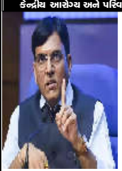
કમલમ્ ન્યૂઝ, કેન્દ્રીય આયોજક અને પરિવાર કલ્યાણ યાત્રા સમયે બોલ્યા બાદ

કેન્દ્રીય આયોજક અને પરિવાર કલ્યાણ યાત્રા સમયે બોલ્યા બાદ મંત્રી ડી. મનુજમ્ માંડવિયાની અધ્યક્ષતામાં થયે આયોજન પાત્રે મંત્રી શ્રી ડી. મનુજમ્ માંડવિયા ની અધ્યક્ષતામાં ભાવનગર લોકસભાક્ષેત્રમાં રમનગમત અને સ્વાસ્થ્યને પ્રોત્સાહન આપવાના ઉદ્દેશ સાથે આઝાદી કા અમૃત મહોત્સવ અંતર્ગત 'સાંસદ ખેલ મહોત્સવ-૨૦૨૩' નું આયોજન તા. ૧૯, ૨૦, ૨૧ અને તા. ૨૮ અને ૨૯ ઓક્ટોબર દરમિયાન કરવામાં આવી રહ્યું છે, જેમાં ભાવનગરના ૨૨૦૦૦ થી વધુ ખેડાઈઓએ નામ નોંધાવ્યા છે. આરમુત સ્વભાવનાર અને ખોટાદાના વિવિધ કેશમાં શિક્ષક કેન્દ્રોમાં તાલુકા/ગ્રામીણ લેવલ કક્ષાએ નોંધવા કક્ષાએ ૨ મનાર છે. તથા ૧૫ થી વધુ ૫૫ થી ઉપર સુધીના