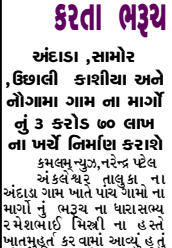
અંકલેશ્વર તાલુકા ના પાંચ ગામો ના માર્ગો નું ખાતમુહૂર્ત કરવામાં આવ્યું હતું

અંકલેશ્વર તાલુકા ના પાંચ ગામો ના માર્ગો નું ખાતમુહૂર્ત કરવામાં આવ્યું હતું. આપી શકાય તે હેતુ થી ભરૂચ વિધાન સભા ક્ષેત્ર માં સમાવેશ અંકલેશ્વર તાલુકા ના ૧૭ ગામો પૈકી અંકલેશ્વર, સામોર, કાશીયા, ઉંઘાલી અને નોગામા ગામના નવા માર્ગોના નિર્માણ માટે રૂબેરૂ ૩ કરોડ ૭૦ લાખ ની કાળીસી ભેટરૂબેરૂ કરવામાં આવી છે. ત્યારે અંકલેશ્વર ગામ માટે ભરૂચ ના ધારાસભ્ય નીલકંઠેશ્વર અમરકાંચો શેલ છે તેમજ બાકી ની સુવિધાઓ