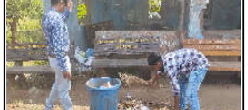
કમલમ્ ન્યૂઝ, આહવા

જન પ્રતીનિધિઓ દ્વારા કરાયેલ 'સ્વચ્છતા હી સેવા' અભિયાનના અંતર્ગત આગળ પાણી તળાવ છે. ડાંગ જિલ્લાના પ્રમુખ શ્રી મહેતા સાહેબ, તથા તાલુકા કક્ષાએ કરવામાં આવેલ છે. આ પ્રસંગે ખેતીવાડી અધિકારી શ્રી સરકાર શ્રી દારા વર્ષ: ૨૦૨૩ ને ચેતન સરસિયા, આના ખજેટર International Year of Mill's તરીકે જાહેરવાનું નક્કી કરવામાં આવેલ છે. મૌલેટ્સ પાકોના સ્વચ્છ વર્ધક મહત્વ, વધુમાં વધુ ઉપાદાન અને વપરાશ