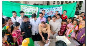
કમલમ્ ન્યૂઝ, નવસારી ખેડૂતો વૈજ્ઞાનિક ઢબે ખેતી કરે તથા સંરક્ષણ કરવામાં આવેલ નવીનતમ ટેકનોલોજી ઝડપથી ખેડૂતો સુધી પહોંચે તે માટે ભારત સરકારે કટોરોલ છે.

કમલમ્ ન્યૂઝ, નવસારી ખેડૂતો વૈજ્ઞાનિક ઢબે ખેતી કરે તથા સંરક્ષણ કરવામાં આવેલ નવીનતમ ટેકનોલોજી ઝડપથી ખેડૂતો સુધી પહોંચે તે માટે ભારત સરકારે કટોરોલ છે. ખેડૂતોને માહિતગાર કરવાના ભાગેશ્વરકાંચ માટે સરકારે દ્વારા દરેક જિલ્લામાં કૃષિવિજ્ઞાન કેન્દ્રોની સ્થાપના કરેલી છે.