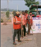
કમલમ્ ન્યૂઝ, સ્વચ્છતા હી સેવા' અભિયાન અંતર્ગત ડી. મેરા ડેશ

કેન્દ્રીય આયોજક અને પરિવાર કલ્યાણ યાત્રા સમયે બોલ્યા બાદ મંત્રી ડી. મનુજમ્ માંડવિયાની અધ્યક્ષતામાં થયે આયોજન પાત્રે મંત્રી શ્રી ડી. મનુજમ્ માંડવિયા ની અધ્યક્ષતામાં ભાવનગર લોકસભાક્ષેત્રમાં રમનગમત અને સ્વાસ્થ્યને પ્રોત્સાહન આપવાના ઉદ્દેશ સાથે આઝાદી કા અમૃત મહોત્સવ અંતર્ગત 'સાંસદ ખેલ મહોત્સવ-૨૦૨૩' નું આયોજન તા. ૧૯, ૨૦, ૨૧ અને તા. ૨૮ અને ૨૯ ઓક્ટોબર દરમિયાન કરવામાં આવી રહ્યું છે, જેમાં ભાવનગરના ૨૨૦૦૦ થી વધુ ખેડાઈઓએ નામ નોંધાવ્યા છે. આરમુત સ્વભાવનાર અને ખોટાદાના વિવિધ કેશમાં શિક્ષક કેન્દ્રોમાં તાલુકા/ગ્રામીણ લેવલ કક્ષાએ નોંધવા કક્ષાએ ૨ મનાર છે. તથા ૧૫ થી વધુ ૫૫ થી ઉપર સુધીના