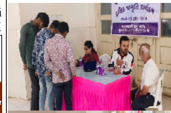
કમલ્લમ ન્યૂઝ, અંકલેશ્વર અંકલેશ્વર તહેલકાણવાડાના સિસોદરા ગામ ખાતે ગામના

સિસોદરા ગામ ખાતે ગામના ડિપ્ટુ યુવા સંગઠન દ્વારા વર્ષ ૧૯૮૦ અને વર્ષ ૧૯૮૨ માં કારસેવા મા અપાયા ગયા હતા. ત્યારબાદ ઈશ્વરસિંહ પટેલ સ્કીટ પર ૧ કારસેવકો નું રામલક્ષ્મી ની પ્રાણપ્રતિષ્ઠા ના પાવન, દિન સન્માન કરવામાં આવ્યું હતું. આથીપાતે પ્રમુદ્ધ શ્રીરામ પાટલ વર્ષ બાદ પુનઃ પ્રાણ પ્રતિષ્ઠા મહોત્સવયોજાઈ હતો. સમગ્ર દેશ અને દુનિયા પ્રભુ શ્રીરામ ની પવનમાણી ના પાવન પ્રસંગે વિદ્યાર્થી શ્રી રામ ની ભક્તિ માં લીન બન્યા છે. ત્યાર સમગ્ર દેશ ના સિસોદરા ગામ ના ડિપ્ટુ યુવા સંગઠન દ્વારા ૧૯૮૦ અને ૧૯૮૨