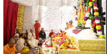
આજે સનાતન સંસ્કૃતિનો નવો યુગ શરૂ થયો

આજનો દિવસ કરોડો રામ ભક્તો માટે અવિસ્મરણીય દિવસ છે. કમલ્લમ ન્યૂઝ, કેન્દ્રીય ગૃહ અને સહકારિતા મંત્રી શ્રી અમિત શાહે કહ્યું છે કે અયોધ્યામાં રામ મંદિરમાં રામ લલાલના જન્મના અભિષેકના સંકલ્પની પૂર્ણાહુતિ સાથે ૫ સદીઓની રાહ અને વચન આપે પૂર્ણ થયું છે. ૭૫૨ તેમની પહેલમાં અજોડના દિવસકરોડો રામ ભક્તો હતા. આ દિવસ રામ મંદિરના અભિષેકના સંકલ્પની પૂર્ણાહુતિ સાથે ૫ સદીઓની રાહ અને વચન આપે પૂર્ણ થયું છે.