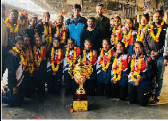
કમલ્લમ ન્યૂઝ, રફૂલ ગેમ્સ ફેડરેશન ઓફ ઈન્ડિયા (SGFI) દ્વારા મધ્યપ્રદેશના સુજલપુર ખાતે

સમગ્ર ભારતની ૩૫ ટીમોએ ભાગ લીધો હતો, એમિડાઇનલમાં ઉત્તરપ્રદેશ અને ફાઇનલમાં પંજાબની ટીમને હરાવી ગુજરાતની ટીમ વિજેતા બની