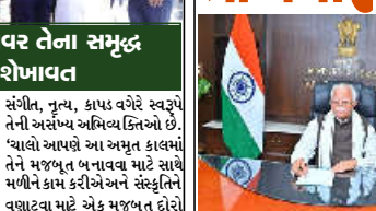
વ્યક્ત કર્યાં હતાં. તેમણે વધુમાં જણાવ્યું હતું કે ઈન્ડિયાથી ભારતના પરિવર્તન દરમિયાન, પ્રધાનમંત્રી શ્રી નરેન્દ્ર મોદીના નેતૃત્વમાં અમે આપણા વસાહતી વચ્ચેને જાળવવા અને આપણા ભવ્ય સાંસ્કૃતિક વારસાને પુનઃ સ્થાપિત કરવા માટે વિશાળ પગલાં લઈ રહ્યા છીએ. શ્રી શોખાવટે જણાવ્યું હતું કે, આપણા દેશની વધતી જતી સંસ્કૃતિ પર તેના સમૃદ્ધ સાંસ્કૃતિક સંરચનામાં છે અને કલા,