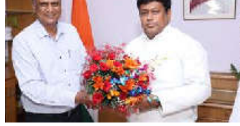
લોકસભામાં સંસદ સભ્ય તરીકે પણ રહી ચુક્યા છે. તેઓ સપ્ટેમ્બર (૨૦૨૧) થી ભાજપ બંગાળના પ્રદેશ અધ્યક્ષ છે. તેઓ બાલુરઘટ (પશ્ચિમ બંગાળ) મતવિસ્તારનું પ્રતિનિધિત્વ કરે છે. તેમણે ઉત્તર બંગાળ નિવર્તિની સ્થાયી વનસ્પતિશાસ્ત્રમાં એમ.એસ.સી.,