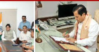
કમલમ્ ન્યુઝ, તા. ૧૧ કેન્દ્રીય મંત્રી સર્બાનંદ સોનોવાલે ૧૦ જુનના રોજ નવી દિલ્હીમાં બંદરો, શિપિંગ અને જળમાર્ગ મંત્રાલયનો કાર્યભાર સંભાળ્યો હતો. પદાધિકારીઓ તેમજ કમંચારીઓને સંબોધતા મંત્રીશ્રીએ આ દેશની જનતાની

"MoPSW દરિયાઈ અમૃત કાલ વિઝન ૨૦૪૭માં દર્શાવ્યા મુજબ સંપૂર્ણ વિકાસ માટે દરિયાઈ ક્ષેત્રને સશક્ત બનાવવાની દિશામાં તેનું કાર્ય ચાલુ રાખશે" : સર્બાનંદ સોનોવાલ