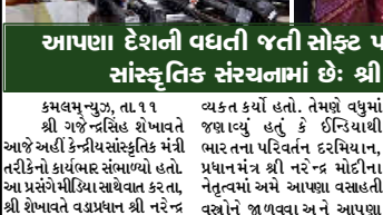
કમલમ્ ન્યુઝ, તા. ૧૧ શ્રી ગજેન્દ્ર સિંહ શોખાવટે આજે અહીં કેન્દ્રીય સાંસ્કૃતિક મંત્રી તરીકેનો કાર્યભાર સંભાળ્યો હતો. આ પ્રસંગે મીડિયા સાથે વાત કરતા, શ્રી શોખાવટે વક્તવ્ય આપીને શ્રી નરેન્દ્ર મોદીનો તેમનાં વિશ્વાસ જગાડવા અને આપણા દેશ અને વિશ્વ બંનેમાં ભારતીયતાની ગતિશીલતાને જાળવવા, સુરક્ષિત કરવા અને તેને આગામી આખા માટે આત્મક આસવાબદલ આભાર