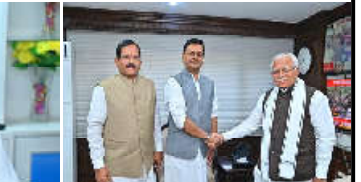
દરેક સાથે રાષ્ટ્ર નિર્માણના હેતુ માટે પોતાને પ્રતિબદ્ધ કરવાનું ચાલુ રાખીશું. અમારું મંત્રાલય અમુક ક્ષત વિઝન, ૨૦૪૭માં દર્શાવ્યું મુજબ સમગ્રતાવા વિચાર માટે દરિયાઈ ક્ષેત્રને સશક્ત બનાવવાની દિશામાં કામ કરવાનું ચાલુ રાખશે."