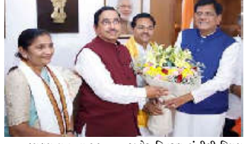
કમલમ્ ન્યુઝ, તા. ૧૧ કેન્દ્રીય મંત્રી શ્રી પ્રહલાદ જોશીએ આજે અધિકૃત રીમી ગ્રાહક બાબતો, ખાધા અને જાહેર પિતરણ મંત્રાલયનો હવાલો સંભાળ્યો. પૂર્વ કેન્દ્રીય ગ્રાહક બાબતો, ખાધા અને

૮૦ કરોડ ભારતીયોની સેવા કરવા સાથે સીધો સંબંધ ધરાવતા આ મંત્રાલયમાં સેવા કરવાની શ્રેષ્ઠ તક: શ્રી જોશી