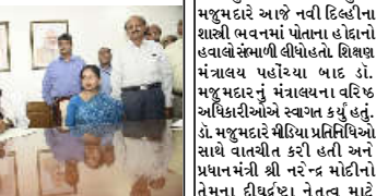
કમલમ્ ન્યુઝ, તા. ૧૧ શિશુ મંત્રાલયમાં નવનિયુક્ત રાજ્યપ્રધાન ડૉ. સુક્તા મજુમદારે આજે નવી દિલ્હીના શાસ્ત્રી ભવનમાં પોતાના હવાલો સંભાળી લીધાં હતાં. શિશુ મંત્રાલય પહોંચ્યા બાદ ડૉ. મજુમદાર નું મંત્રાલયના વરિષ્ઠ અધિકારીઓએ સ્વાગત કર્યું હતું. ડૉ. મજુમદારે મીડિયા પ્રતિનિધિઓ સાથે વાતચીત કરી હતી અને પ્રધાનમંત્રી શ્રી નરેન્દ્ર મોદીનો તેમના દીર્ઘદર્ષી નેતૃત્વ માટે આભાર વ્યક્ત કર્યાં હતાં. ડૉ. મજુમદારે શિશુ મંત્રી શ્રી ધર્મેન્દ્ર પ્રધાનને પણ અભિનંદન આપ્યાં કર્યું હતું, તેમની હાલેથી અનુભવ તેમને મંત્રાલયમાં કામ કરવામાં તેમને શિશુ શ્રેણીમાં પ્રધાનમંત્રીનાં વિજ્ઞાન સંસ્કાર કરવામાં મદદરૂપ થશે. ડૉ. સુક્તા મજુમદાર ૧૭મી