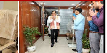
આ દિશામાં તેમનાં સારાં કાર્યોને જળવી રાખવા અપીલ કરી હતી. આ પ્રસંગે શ્રી સર્બાનંદ સોનોવાલે જણાવ્યું હતું કે, પ્રધાનમંત્રી શ્રી નરેન્દ્ર મોદીએ ગતિશીલ નેતૃત્વ હેઠળ બંદરો, શિપિંગ અને જળમાર્ગ મંત્રાલય આર્થિક પાવર હાઉસ બનાવવાના અમારા