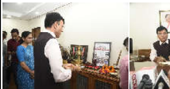
કમલમ્ ન્યુઝ, તા. ૧૧ શ્રી મનસુખ માંડવિયાએ આજે શાસ્ત્રી ભવનમાં કેન્દ્રીય યુવા બાબતો અને રમતગમત મંત્રી તરીકેનો કાર્યભાર સંભાળ્યો છે. તેઓ કેન્દ્રીય શ્રમ અને રોજગર મંત્રીને પેટકોલિયો પણ પસંદ કરે છે. રમતગમત વિભાગના સચિવ અને યુવા બાબતોના વિભાગના સચિવ તેમજ મંત્રાલયનાં વરિષ્ઠ અધિકારીઓએ મંત્રીનું સ્વાગત કર્યું હતું. આ પ્રસંગે યુવાબાબતો અને રમતગમત રાજ્યમંત્રી શ્રીમતી રશ્માનિખલ ખરેસે પણ ઉપસ્થિત રહ્યા હતા. મંત્રાલયના વરિષ્ઠ અધિકારીઓ દ્વારા કેન્દ્રીય યુવાઓને સંબંધિત યોજનાઓ અને પહેલ વિશે માહિતીગાર કરવામાં આવ્યા હતા. આખે તેમણે કેન્દ્રીય રસાયણ અને ખાતર મંત્રી અને કેન્દ્રીય સ્વાસ્થ્ય અને પરિવહન કલ્યાણ મંત્રીનો હવાલો સંભાળ્યો હતો.