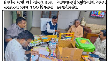
તેમને તક આપવા બદલ આભાર માન્યો હતો. શ્રી જોશીએ કહ્યું હતું કે, "હું આભારી છું કે માનનીય પ્રધાનમંત્રીએ મને આ મંત્રાલયમાં સેવા કરવાની તક આપી છે, જેનો સીધો સંબંધ ૮૦ કરોડ ભારતીયોની સેવા સાથે છે." શ્રી જોશીએ વધુમાં જણાવ્યું હતું કે, પ્રધાનમંત્રી ગરીબ કલ્યાણ અરા યજ્ઞના મુખ્ય યોજના છે, જે જાહેર વિસ્તરણ વ્યવસ્થા મારફતે નિશ્ચયક અનાજ પ્રદાન કરે છે. તેમણે કહ્યું હતું કે, તેમની પ્રાથમિકતા ભૂતવું