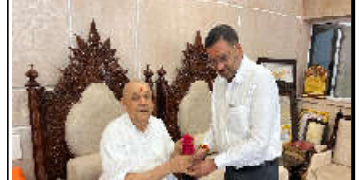
બી.એડ અને પીએચ.ડી કર્યું છે. તેઓ પશ્ચિમ બંગાળના મલદહ જિલ્લામાં આવેલી ગૌર બાંગ્લા યુનિવર્સિટીમાં વનસ્પતિશાસ્ત્રના પ્રોફેસર છે. તેઓ ૨૦૧૮ થી ઈન્કમેશન ટેકનોલોજી અને અરજીઓ પરની સંમિતિની સ્થાયી સમિતિના સભ્ય હતા.