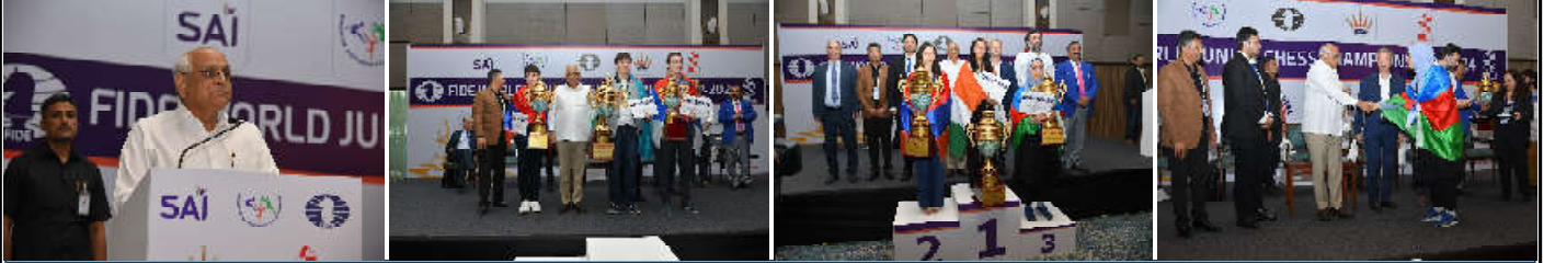
આ ચેમ્પિયનશિપના વર્લ્ડ લેવેલના ખેલાડીઓ અનુભવ-જ્ઞાન કૌશલ્યનો લાભ પોતાના દેશ-રાજ્યના ઉભરતા ખેલાડીઓને આપે: મુખ્યમંત્રી શ્રી ભૂપેન્દ્ર પટેલ વડું પ્રેરક આહવાન

૪૬ દેશોના ૨૨૫થી વધુ ખેલાડીઓ સહભાગી થયા: ભારતની પાંચ દીકરીઓ સહિત છ ચેસ ખેલાડીઓએ મેડલ્સ-ઘનામો જીત્યા