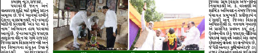
જસદણ-વીંછિયા પંથકમાં ચાલુ વર્ષે આશરે એક લાખ રોપાઓના વાવેતરના લક્ષ્યાંક સામે ૩૨ હજાર રોપાઓનું વાવેતર થયું