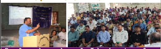
જિલ્લાની શાળાઓની ૧૩૦ જેટલા તાલીમાર્થીઓ કાર્યશાળામાં સહભાગી થયા

કમલમ્ ન્યુઝ, વડોદરા વડોદરા સરકારના શિક્ષણ મંત્રાલય તથા રાષ્ટ્રીય બાલ અભિક્ષાર સંસ્થાના આયોજીત વડોદરા જિલ્લામાં નેશનલ કમિશન ઓફ પ્રોટેક્શન ઓફ ચાઇલ્ડર ઓફ સુરક્ષા (NCPDR) દ્વારા બાળકોની સુરક્ષા વિષય પર એક દિવસીય કાર્યશાળા યોજવામાં આવ્યું હતું જેમાં જિલ્લાના ૧૩૦ તાલીમાર્થીઓએ તાલીમ મેળવી હતી. આ કાર્યશાળામાં વડોદરાના ૮ તાલુકાના ૧૩૦ તાલીમાર્થીઓ સહભાગી થયા હતા જેમાં જિલ્લા પ્રાથમિક શિક્ષણિકારીશ્રી