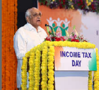
અમદાવાદમાં વડાપ્રધાન આયકર દિવસ-ઇકમટેક્સ કે ની ઉજવણીમાં મુખ્યમંત્રીશ્રીની શ્રેષ્ઠ ઉપસ્થિતિ

'ઓનરિંગ ઇ ઓનેસ્ટ' : મુખ્યમંત્રી શ્રી ભૂપેન્દ્ર પટેલના હસ્તે કરદાતાઓનું સન્માન થયું