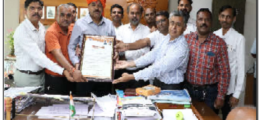
કમલમ ન્યૂઝ: મુખ્યમંત્રી શ્રી ભૂપેન્દ્ર પટેલે આયકર દિવસ-ઇકમટેક્સ કે ની ઉજવણીમાં ઉદ્ઘાટન કાર્યક્રમમાં ઉપસ્થિતિ કરી હતી. તેમણે જણાવ્યું કે, ટેક્સ પદ્ધતિને સુધારવાની જરૂર છે અને તેને સરળ બનાવવાની જરૂર છે.

કમલમ ન્યૂઝ: ગુજરાતની મુલાકાત લીધી છે. તેની પ્રત્યાપ્તિ અને ગુજરાતના વિકાસને પ્રભાવિત થતા ભૂતાનના રાજા શ્રી જીગ્મે ખેસર નામગ્યેલ વાંગચુક તથા પ્રધાનમંત્રી શ્રી શેરિંગ તોબગે એઆજેસવારે ગિફ્ટ સિટીની મુલાકાત લીધી. તેમણે જણાવ્યું કે, ગિફ્ટ સિટીની મુલાકાત લીધી છે અને તેને સરળ બનાવવાની જરૂર છે.