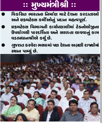
મુખ્યમંત્રી શ્રી ભૂપેન્દ્ર પટેલના હસ્તે કરદાતાઓનું સન્માન થયું

કમલમ ન્યૂઝ: મુખ્યમંત્રી શ્રી ભૂપેન્દ્ર પટેલે જણાવ્યું છે કે, વડાપ્રધાન શ્રી નરેન્દ્રભાઈ મોદીના નેતૃત્વમાં પાછલા દશકામાં દેશમાં ડિજિટલ ટેક્સને આગળ તરફ લાવવાની પારદર્શિતા અને સરળતા લાવવાનો અભિગમને પરિણામ પ્રાપ્ત કરી સોફ્ટવેર સિસ્ટમ હવે પીપલ સેન્ટ્રીક બની છે. મુખ્યમંત્રી શ્રી ભૂપેન્દ્ર પટેલે આયકર દિવસના અમદાવાદમાં ૧૬મી માસ આયકર દિવસ-ઇકમટેક્સ કે ની ઉજવણીમાં ઉદ્ઘાટન કાર્યક્રમમાં ઉપસ્થિતિ કરી હતી. તેમણે જણાવ્યું કે, ટેક્સ પદ્ધતિ પ્રત્યેક વ્યક્તિની જીવનશૈલી સાથે સંબંધિત છે અને તેને સંસ્કાર કરવાની જરૂર છે. આ પ્રસંગે મુખ્યમંત્રી શ્રી ભૂપેન્દ્ર પટેલે જણાવ્યું કે, ટેક્સ પદ્ધતિને સુધારવાની જરૂર છે અને તેને સરળ બનાવવાની જરૂર છે. આ પ્રસંગે મુખ્યમંત્રી શ્રી ભૂપેન્દ્ર પટેલે જણાવ્યું કે, ટેક્સ પદ્ધતિને સુધારવાની જરૂર છે અને તેને સરળ બનાવવાની જરૂર છે.