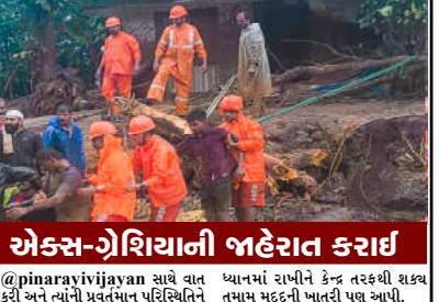
@pinaravijayan સાથે વાત કરી અને ત્યાંની પ્રતંતમા પરિસ્થિતિને ધ્યાનમાં રાખીને કેન્દ્ર તરફથી શક્ય તમામ મદદની ખાતરી પણ આપી.