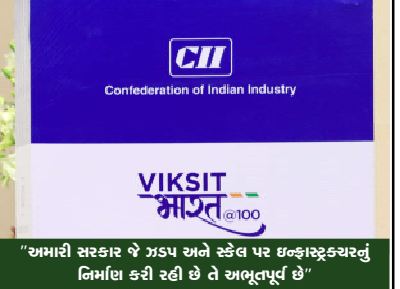
"અમારી સરકારનો ઉદ્દેશ અને પ્રતિબદ્ધતા ખૂબ જ સ્પષ્ટ છે, અમારી દિશામાં કોઈ કાચવર્ગન નથી"

જરૂરી કામગીરી મૂકી અને વિરાલ મળી રહે. તેમની બજેટ, સુલભતા અને સંભાવનાઓમાં સંપૂર્ણ ધ્યાન અને તેમને આંધ્યાત્મિક સ્વરૂપે આપવામાં આવે." શ્રી મોદીએ ઉમેર્યું હતું કે, તેમણે વધુમાં તેમના માટે કરવામાં યોગ્ય અને આંધ્યા પાલનમાં જોડી પાતરી આપી છે. પ્રધાનમંત્રીએ અંદાજપત્રમાં કેટલાક મુદ્દાઓ પર ભાર મૂક્યો હતો, જે કે પરમાણુ ઊર્જા ઉત્પાદન માટે કાળવસ્તીમાં વધારો, કૃષિ માટે ડિજિટલ પબ્લિક ઇન્ફ્રાસ્ટ્રક્ચર, ખેડૂતોની જમીનના પાકલની સુધ્યા પ્રદાન કરવા માટે ભૂ-આચાર કાર્ડ, અંતરિક્ષ અર્થતંત્ર માટે ૧૦૦૦ કરોડને વેન્ચર કેપિટલ ફંડ, ડિજિટલ મિનિસ્ટર મિશન અને ખાણકામ માટે આંકડો ૧૦૦ કરોડની આગમી હરજી, તેમણે જણાવ્યું હતું કે, આ નવી જહેરાતો પ્રગટિયા નવા માર્ગો ખોલશે." ભારત દુનિયામાં નીજ કમનું સૌથી મોટું અર્થતંત્ર બનાવવાનો દિશામાં અગ્રેસર છે ત્યારે સમરોહિત જોવામાં ખાસ કરીને તેમણે સર્જન થઈ રહ્યું છે એ ભાવતનો ઉલ્લેખ કરીને પ્રધાનમંત્રીએ ભવિષ્યમાં મોટા પાયે કૌશલ્ય ભજવવા માટે સેમિકન્ડક્ટર વેલ્યુ ચેઇનમાં નામ રોશન કરવાની જરૂરિયાત વ્યક્ત કરી હતી. એવેલ પ્રધાનમંત્રીએ કહ્યું હતું કે, સરકાર સેમિકન્ડક્ટર ઉદ્યોગને પ્રોત્સાહન આપવા પર ભાર મૂકી રહી છે. તેમણે ખાસ કરીને મોબાઇલ ઉત્પાદન કોર્સોના વર્તમાન યુગમાં ઇલેક્ટ્રોનિક્સ ઉત્પાદનને પ્રોત્સાહન આપવા પર પણ વાત કરી હતી. ભૂતકાળમાં આચારકાર બનાવેલી ભારત કૌશલ્ય રીતે ટોચના મોબાઇલ ઉત્પાદક અને નિર્માણકારમાં પરિવર્તન થયું તે અંગે તેમણે સમર્થન દર્શાવ્યું. પીએમ મોદીએ ભારતમાં શ્રીન જોડેલ સેક્ટરના રોડ મપનો પણ ઉલ્લેખ કર્યો હતો, જે શ્રીન ઉદ્યોગજગત અને ઈ-વૈશ્વિક ઉદ્યોગોને પ્રોત્સાહન આપે છે. આ વર્ષના બજેટમાં મોટાભાગે પહેલાની ભહેરાત કરવા થઈ રહી છે એ ભાવતની નોંધ લઈને