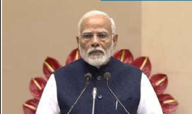
"રોજગારી બોલા છતાં ભારતની રાજકીય સમજદારી વિશ્વ માટે રોલ મોડેલ છે"

"હું ઉદ્યોગોને અને ભારતના પાનગી ક્ષેત્રને પણ વિકસિત ભારતના નિર્માણ માટે એક શક્તિશાળી નિર્માણ માનું છું"