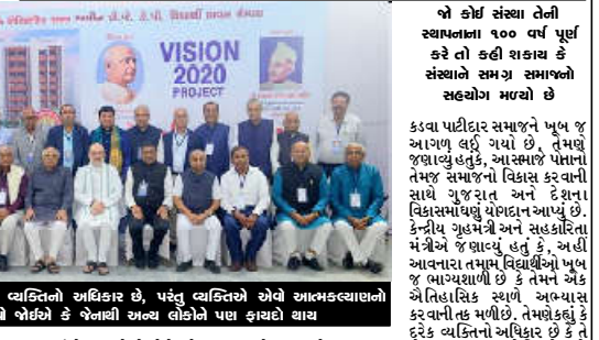
જો કોઈ સંસ્થા તેની સ્થાપનાના ૧૦૦ વર્ષ પૂર્ણ કરે તો કહી શકાય કે સંસ્થાને સમગ્ર સમાજનો સહયોગ મળ્યો છે