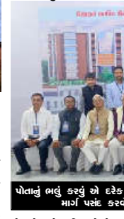
પોતાનું ભવું કરવું એ દરેક વ્યક્તિનો અધિકાર છે, પરંતુ વ્યક્તિએ એવો આમતકલ્યાણનો માર્ગ પસંદ કરવો જોઈએ કે જેનાથી અન્ય લોકોને પણ ફાયદો થાય

કેન્દ્રીય ગૃહ મંત્રી અને સહકાર મંત્રી શ્રી અમિત શાહે અમદાવાદમાં અમીન પીજીકેપી વિદ્યાર્થી ભવનનું ઉદ્ઘાટન કર્યું છે. આ પ્રસંગે જગન્નાથજીની રથયાત્રાના મુખ્યમંત્રી શ્રી ભૂપેન્દ્ર પટેલ સાથે અને કમલમ્ ગ્રુપ ઓફ ઇન્ફર્મેશન ટેકના સી.ઓ. શ્રી અમિત શાહે અમદાવાદમાં આધુનિક હોસ્પિટલનું પણ ઉદ્ઘાટન કર્યું છે. આ પહેલા શ્રી અમિત શાહે અમદાવાદના શ્રી જગન્નાથ મંદિરમાં મંગળા આરતી કરી હતી.