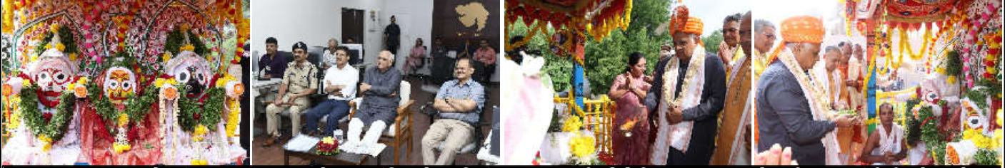
ગુજરાત તથા સમગ્ર દેશમાં કાયમ સદભાવના, એકતા, શાંતિ અને સમૃદ્ધિનું વાતાવરણ બની રહે તેવી પ્રભુ જગન્નાથજીને પ્રાર્થના- મુખ્યમંત્રીશ્રી ભૂપેન્દ્ર પટેલ

સોનાની સાવરણીથી રથની સફાઈ સેવાની પરંપરા નિભાવી મુખ્યમંત્રીશ્રીએ ભગવાન જગન્નાથજીનો રથ ખેંચ્યો