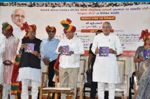
પરીક્ષામાં નાપાસ થતા વિદ્યાર્થીઓથી લઈને ગુણવત્તા સંઘર્ષથી લારીને નાસીપાસ થતા દરેક નાગરિકે 'આગુવન ચોડ્યા' પુસ્તક અચૂક વાંચવું: સહકાર રાજ્ય મંત્રી શ્રી જગદીશ વિશ્વકર્મા

મુખ્યમંત્રી શ્રી ભૂપેન્દ્ર પટેલે સામાજિક ન્યાય અને અધિકારીતા રાજ્ય મંત્રી શ્રી ભીખુસિંહ પરમારની ગુણવત્તા કપરા પર આધારિત કોફી ટેબલ બુક "આગુવન ચોડ્યા" નું વિમોચન કર્યું