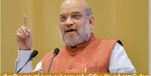
શ્રી અમિત શાહ વર્ષ ૨૦૨૩ અને ૨૦૨૪ માટે પ્રતિષ્ઠિત સેવા માટે રાષ્ટ્રપતિ મેડલ (PSM) અને રાષ્ટ્રપતિ મેડલ ફોર મેરીટોરીયસ સર્વિસ (MISM) પ્રાપ્ત કરનારાઓનું પણ સન્માન કરશે