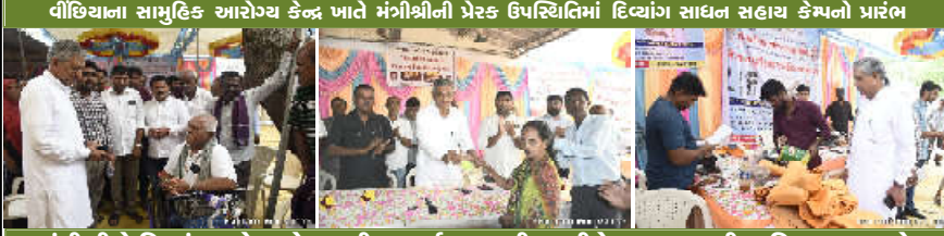
વીણિયાના સામુહિક આરોગ્ય કેન્દ્ર ખાતે મંગીશ્રીની પ્રેરક ઉપસ્થિતિમાં દિવ્યાંગ સાધન સહાય કેમ્પનો પ્રારંભ