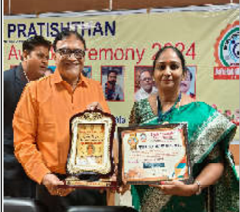
ગુજરાત રાજ્યના ૧૩૦ શિક્ષકોનું સન્માન કરવામાં આવ્યું