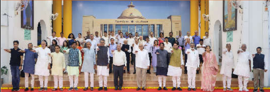
નાગરિકો ભારત વિકાસ પ્રતિજ્ઞા https://pledge.mygov.in/bharat-vikas/ પોર્ટલ પર ઓનલાઈન લઈને પ્રમાણપત્ર મેળવી શકાશે

મુખ્યમંત્રી શ્રી ભૂપેન્દ્ર પટેલ તથા રાજ્ય મંત્રીમંડળના મંત્રીશ્રીઓ - મુખ્ય સચિવશ્રી તથા વરિષ્ઠ સચિવશ્રીઓ અને અધિકારીઓએ વડાપ્રધાન શ્રી નરેન્દ્રભાઈ મોદીએ જોયેલા વિકસિત ભારતના સ્વપ્નને સાકાર કરવા મન-વચન અને કર્મથી તત્પર રહેવા સાથે દેશ માટે સમર્પિત ભાવની સામુહિક ભારત વિકાસ પ્રતિજ્ઞા લીધી