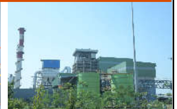
અમદાવાદના પીપળજ ખાતે PPP ધોરણે શરૂ કરાયેલા પ્લાન્ટમાં દૈનિક ધોરણે ૧૦૦૦ મેટ્રિક ટન કચરાના નિકાલ થકી કલાકની ૧૫ મેગા વોટ વીજળી ઉત્પન્ન કરાશે