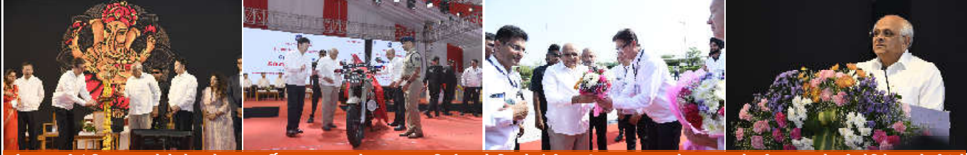
વર્ષ-૨૦૨૦ સુધીમાં વિહ્વાપુર ખાતેનો હોન્ડાનો પ્લાન્ટ વાર્ષિક ૨૬.૧૦ લાખ મોટરસાઈકલના નિર્માણ સાથે વિશ્વનો સૌથી વધુ ઉત્પાદન ક્ષમતાવાળો પ્લાન્ટ બનશે: શ્રી ત્યુત્સુમુ ઓતાની, પ્રેસિડેન્ટ અને સીઈઓ

વડાપ્રધાનશ્રીએ આપેલા મેઈક ઈન ઈન્ડીયા — મેઈક ડ્રોર ઇ વર્લ્ડ મંત્રને માંડલ-બેચરાજી-વિહ્વાપુર વિસ્તાર ઓટોમોબાઈલ હબ બનીને સાકાર કરે છે: મુખ્યમંત્રીશ્રી