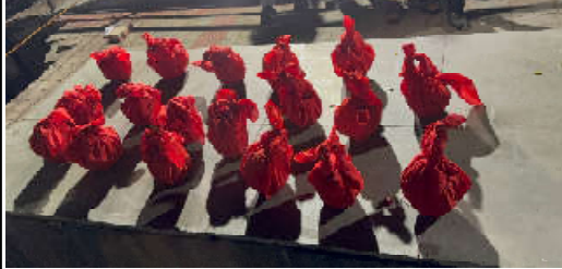
વિદ્યા સ્થાનમાં સ્કાઉટ ક્લબના પ્લેન ક્રેશ દુર્ઘટનામાં ગુજરાત સરકારનો ઉક્ત મહાનવીય અભિયાન - મોહતી મહાત્મા જાણીને એક એક માનવ અંગો - નક્ષર અવશેષોની અંતિમ વિધિ સરકારે સુનિયંત્રિત કરી