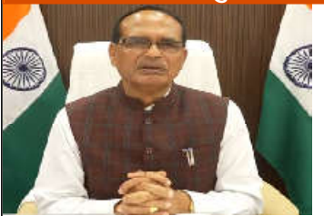
કચ્છભૂમિ કેન્દ્રીય કૃષિ અને ખેડૂત કલ્યાણ મંત્રી અને ખેડૂત કલ્યાણ મંત્રી અને ગ્રામીણ વિકાસ મંત્રી શ્રી શિવરાજ સિંઘ ચૌહાણે પાટણ બેઠકની આયોજીત કચ્છમાં આજે એક વિડીયો સંદેશ

કપાસની ઉત્પાદકતા અને ગુણવત્તા વધારવા માટે ખાસ વિચારણા કરવામાં આવી રહી છે - શ્રી ચૌહાણ