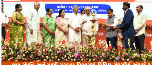
જળ સંપત્તિ અને પાણી પુરવઠા વિભાગમાં વિવિધ સંવર્ગોમાં અંદાજે ૩,૫૦૦ થી વધુ જગ્યાઓ પર ભરતી કરાશે: મંત્રી શ્રી હુવરજીભાઈ ઠાવળિયા

ડેમોગ્રાફિક ડિવિઝન્સ-યુવાશક્તિની સેવાઓથી વિકસિત ભારત @ 2047 માટે વિકસિત ગુજરાત @ 2047 ના નિર્માણમાં નવી ગતિ આવશે: મુખ્યમંત્રી શ્રી ભૂપેન્દ્ર પટેલ