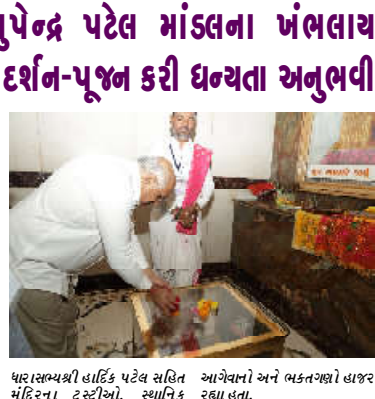
ધારાસભ્યશ્રી હાર્દિક પટેલ સહિત આગેવાનો અને ભક્તવર્ગો હાજર મંદિરના ટ્રસ્ટીઓ, સ્થાનિક રહ્યા હતા.

કમલમ્, માંડલ નવા વર્ષની શુભ શરૂઆતના અવસરે મુખ્યમંત્રીશ્રી ભૂપેન્દ્ર પટેલે માંડલ તાલુકા સ્થિત ખંભલાય માતાજી મંદિરમાં વિશિષ્ટ દર્શન કરીને પૂજન-અર્ચન કર્યું હતું. આ અવસરે તેમણે રાજ્ય તથા પ્રદેશની સુખ-સમૃદ્ધિ, શાંતિ અને કલ્યાણ માટે પ્રાર્થના કરી અને આત્મિક ધન્યતા અનુભવી હતી. સાથે સમગ્ર વાનાવરણ ભક્તિભાવ અને આધ્યાત્મિક ઊજ્જ્વળ પ્રેરિત બન્યું હતું. ખંભલાય માતાજી મંદિર ભક્તિ, વિશ્વાસ અને પરંપરાનું પ્રતીક સાથે જનમાનસની અસ્થા સાથે જોડાયેલું સક્રિય સાધનોનું પવિત્ર સ્થાન છે. દર્શન-પૂજન દરમિયાન