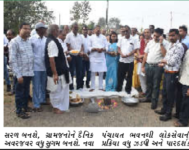
સરળ બનશે, ગ્રામજનોને દૈનિક અવરજવર વધુ સુગમ બનશે. નવા પંચાયત ભવનથી લોકસેવાની પ્રક્રિયા વધુ ઝડપી અને પારદર્શક