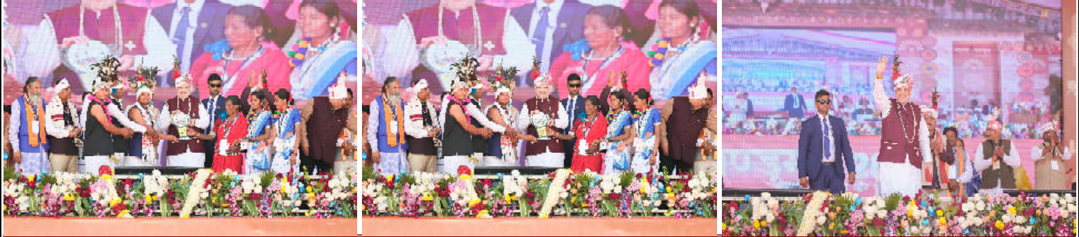
આગામી પાંચ વર્ષમાં બસ્તર તમામ આદિવાસી વિસ્તારોમાં સૌથી વિકસિત પ્રદેશ બનશે અને નવી પર્યટન પ્રવૃત્તિઓ બસ્તરને રોજગારીની તકોથી સમૃદ્ધ બનાવશે

ભગવાન બિરસા મુંડાની જન્મજયંતિને 'જનજાતીય ગૌરવ દિવસ' અને તેમની ૧૫૦મી જન્મજયંતિને 'જનજાતીય ગૌરવ વર્ષ' તરીકે જાહેર કરવી એ આદિવાસી સમુદાય પ્રત્યે મોદીજીના સન્માનનો સ્પષ્ટ પુરાવો છે