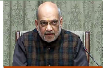
મુખ્યમંત્રી શ્રી ભૂપેન્દ્ર પટેલ, કેન્દ્રીય મંત્રીશ્રી પ્રહલાદ જોષી, નાયબ મુખ્યમંત્રી શ્રી હર્ષભાઈ સંઘવી પણ રહેશે ઉપસ્થિત

કમલમ્, ગુજરાત સરકારના અગ્ર, નાગરિક પુરવઠા અને ગ્રાહક બાબતોના વિભાગ દ્વારા રાજ્યની જાહેર વિતરણ વ્યવસ્થા (PDS) ને સંપૂર્ણપણે ડિજિટલ અને પારદર્શક બનાવવા માટે અનેક લોકલક્ષ્યાકર પ્રકલ્પોનો શુભારંભ કરવામાં આવ્યો. આગામી ૧૫ ફેબ્રુઆરી, ૨૦૨૬ ને રવિવારના રોજ કેન્દ્રીય ગૃહ મંત્રી શ્રી અમિતભાઈ શાહના હસ્તે ગાંધીનગરના મહાત્મા મંદિર ખાતેથી આ વિવિધ નવતર પ્રકલ્પોનો પ્રારંભ થયો. આ પ્રસંગે મુખ્ય રાજ્યના મુખ્યમંત્રી શ્રી ભૂપેન્દ્રભાઈ પટેલ, કેન્દ્રીય ગ્રાહક બાબતો, ખાદ્ય અને જાહેર વિતરણ મંત્રી શ્રી પ્રહલાદ જોષી અને નાયબ મુખ્યમંત્રી શ્રી હર્ષ સંઘવી પણ ઉપસ્થિત રહેશે. આ ઉપરાંત રાજ્યના અગ્ર અને નાગરિક પુરવઠા મંત્રી શ્રી રમણભાઈ સોલંકી, કેન્દ્રીય રાજ્ય મંત્રી શ્રીમતી નિમિષેન બાંબણિયા, કેન્દ્રીય રાજ્ય મંત્રી શ્રી બી. એલ. વર્મા તેમજ રાજ્ય કક્ષાના મંત્રી શ્રી પૂનમચંદ બરડા પણ ઉપસ્થિત રહેશે.