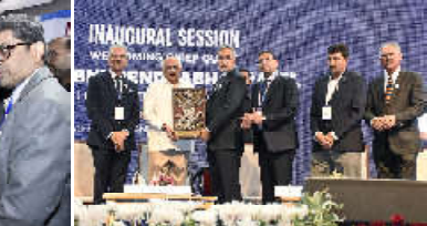
શેત્રોની સિદ્ધિઓની ભૂમિકા આપતા જણાવ્યું હતું. વડાપ્રધાન શ્રી નરેન્દ્રભાઈ મોદીએ વિકસિત ભારત ૨૦૪૦નું જે આદેશનું રાજ્ય જેવું તેને ગુજરાતની ક્ષમતાઓ રાજ્ય સરકાર સાથે સહયોગ કરીને ગુજરાત એમ્બર ઓફ કોમર્સ વિશે સ્તરે વિકસાવીને પાર પાડશે તેવો મુખ્યમંત્રીશ્રી ભૂપેન્દ્ર પટેલે વિશ્વાસ વ્યક્ત કર્યું હતો. તેમણે એક્સપોના આ બીજી કડીની સંક્રમણ માટે શુભેચ્છાઓ પાઠવી હતી. આ પ્રયોગો ડેવેલપમેન્ટના વાઈસ મોડેલને કહ્યું હતું કે, હવે વધુ વૈવિધ્ય જમાવવાનું અનિચિત્ત થયેલું રહી છે, ત્યારે વડાપ્રધાનશ્રીના નેતૃત્વમાં ભારતમાં ઈન્ડસ્ટ્રીના વિકાસ માટે મહત્વની નીતિઓ