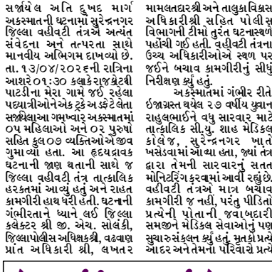
કમલામ, સુરેન્દ્રનગર સુરેન્દ્રનગર જિલ્લાના લખનર-વિરમગામ હાઈવે પર ભાસ્કરરા અને ઇશદે ગામ વચ્ચે