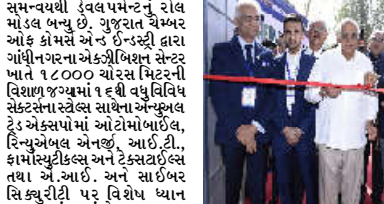
વિજન - ગ્લોબલ એક્સ્પોઝીશનની થીમ સાથે યોજાઈ રહેલો આ એક્સપો એમ.એસ.એમ.ઈ. અને યુવા સાહસિકો માટે લોકલથી ગ્લોબલનું પ્લેટફોર્મ પૂરું પાડશે તેવો વિશ્વાસ વ્યક્ત કર્યું હતો. તેમણે કહ્યું કે, વડાપ્રધાન શ્રી નરેન્દ્રભાઈના નેતૃત્વમાં શરૂ થયેલી વાઈબ્રન્ટ સમિટીની ઉત્તરોત્તર સફળતાથી ગુજરાત ગ્લોબલ એન્ટરપ્રેન્ડાઈઝી સ્પીરિટ બન્યું છે. પોલિસી ડિવન રેટેટ ટરીકીની ગુજરાતની જેખ્યાતિ છે તેમાં પોલિસી મેકિંગ માટે શાઉન્ડ રીપોર્ટ અને કિડબેક આપવાનું મહત્વનું કામ એમ્બર ઓફ કોમર્સ કરે છે. આ ઉપરાંત વાયબ્રન્ટ સમિટીના આ યોજાણની લઈને એક્ટીવિશનમાં પણ રાજ્ય સરકારની સાથે રહી છે.