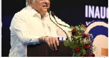
કમલામ, મુખ્યમંત્રી શ્રી ભૂપેન્દ્ર પટેલે ગુજરાત યેમ્બર ઓફ કોમર્સ એન્ડ ઈન્ડસ્ટ્રીના બીજા એન્યુઅલ ટ્રેડ એક્સપોનું ગાંધીનગરમાં ઉદ્ઘાટન કરતા રાષ્ટ્રપત્ની જહાનગી કે. વડાપ્રધાન શ્રી નરેન્દ્રભાઈ મોદીના માર્ગદર્શનથી ગુજરાત ટ્રેડ એન્ડ ઈન્ડસ્ટ્રી એન્ડ એન્ટરપ્રેન્ચોરશીપના સભ્યવયથી કેવલપમેન્ટનું રોલ મોડલ બન્યું છે. ગુજરાત યેમ્બર ઓફ કોમર્સ એન્ડ ઈન્ડસ્ટ્રી દ્વારા ગાંધીનગરના એક્ટીવિશન સેન્ટર ખાતે ૧૮૦૦૦ ચોરસ મિટરની વિશાળ જગ્યામાં ૧૬૫ વધુ વિવિધ સેક્ટરના સ્ટેલ્સ સાથેના એન્યુઅલ ટ્રેડ એક્સપોમાં આંતરોબાહીલ, વિન્યોબલ એનજી, આઈ.ટી., કાર્મોસ્ટ્રીકલ્સ અને ટેક્સટાઇલ્સ તથા એ.આઈ. અને સાઈબર સિક્યુરીટી પર વિશેષ ધ્યાન આપવામાં આવ્યું છે. આ ગુજરાત

વડાપ્રધાન શ્રી નરેન્દ્રભાઈ મોદીના માર્ગદર્શનથી ગુજરાત ટ્રેડ એન્ડ ઈન્ડસ્ટ્રી એન્ડ એન્ટરપ્રેન્ચોરશીપના સભ્યવયથી કેવલપમેન્ટનું રોલ મોડલ બન્યું છે : મુખ્યમંત્રી શ્રી ભૂપેન્દ્ર પટેલ