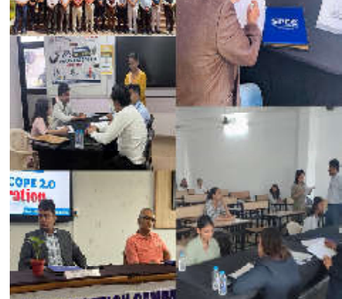
આ કાર્યક્રમમાં સુરેન્દ્રનગર જિલ્લાના લખનર-વિરમગામ હાઈવે પર ભાસ્કરરા અને ઇશદે ગામ વચ્ચે