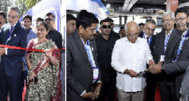
મુખ્યમંત્રીશ્રીએ ઉમેર્યું કે, ઉદ્યોગોને આત્મનિર્ભર બનાવવાનો મેકેક ઈન ઈન્ડિયા મેકેક ફોર યુ વર્લ્ડનો વડાપ્રધાનશ્રીએ જે થ્યે વખ્યાં છે તે ગુજરાત ટ્રીન ઓથ, ફિન્યુએબલ એનજી, ઈ.ટી. મોયુ, ફિન્યુએબલ, સુમિક્ક-ડક્ટર જેવા ઈમજીંગ સેક્ટરમાં લિડ લઈને સાકાર કરવા આ ગળ વધી રહ્યું છે. દેશના જી.ડી.પી.માં ગુજરાત ૮.૩ ટકા, ઈન્ડસ્ટ્રીયલ ઓઉટપુટમાં ૧૮ ટકા અને એક્સપોર્ટમાં ૩૧ ટકાનો ફાળો આ પે છે. વિકસિત ભારતના નિર્માણની સૂકલિ ક્ષમિ માટે અનિગ વેલ-લિવિંગ વેલના મંત્ર સાથે વિકસિત ગુજરાત જ ૨૦૪૦ રોડમપ તૈયાર કરનાર ગુજરાત દેશનું પહેલું રાજ્ય છે તેમ મુખ્યમંત્રીશ્રીએ ગુજરાતની વિવિધ