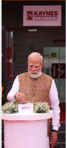
ભારત વેશ્ચિક બજારમાં વિશ્વસનીય સેમિકન્ડક્ટર સલાહર તરીકે તેની ભૂમિકા મજબૂત કરી રહ્યું છે: પ્રધાનમંત્રી