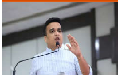
કમલમ્, ગુજરાત સરકારના ઉદ્યોગ અને MSME વિભાગ દ્વારા

MSME ની વિવિધ યોજના હેઠળ ૧૭૧૫ લાભાર્થીઓને ૮૦.૬૬ કરોડ, ટેકાટાઇલ યોજનામાં ૨૦૨ લાભાર્થીઓને ૧૮૪.૯૭ કરોડ તથા લાર્જ ઇન્ડસ્ટ્રીના ૧૨૬ લાભાર્થીઓને ૧૮૮.૭૭ કરોડની સહાય ચૂકવાઈ