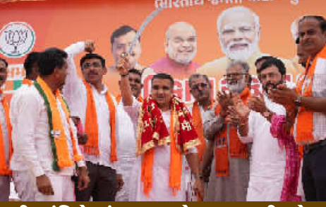
હવાલાના કરોડો રૂપિયાના દુરુપયોગથી ગુજરાતની શાંતિને ભંગ કરવાનો પ્રયાસ કરી રહેલ વક્ષનો પણ આ ચુંટણીમાં જનતા સફાયો કરશે -શ્રી હર્ષભાઈ સંઘવી

કલમ, સ્થાનિક સ્વરાજ્યની મુદ્દાઓના અનુસંધાને બનાસકાંઠા જિલ્લાના વડગામ ખાતે રાજ્યના નાયબ મુખ્યમંત્રી શ્રી હર્ષભાઈ સંઘવીની ઉપસ્થિતિમાં 'વિકાસ સંકલ્પ સભા' યોજાઈ હતી. આ સભામાં સ્થાનિક લોકો માટે સંબંધિત ઉમદી પડ્યા હતા. આ પ્રસંગે નાયબ મુખ્યમંત્રી શ્રી હર્ષભાઈ સંઘવીએ કોંગ્રેસ પર પ્રહાર કરતાં જણાવ્યું હતું કે, કોંગ્રેસના શાસનમાં રાજ્યમાં પ્રાથમિક સુવિધાઓ જેવી કે વીજળી, પાણી અને માંગ વ્યવસ્થા પણ ઉપલબ્ધ નહોતી, જ્યારે ભાજપના શાસનમાં આ તમામ સુવિધાઓ ઉપલબ્ધ થઈ છે. શ્રી મુખ્યમંત્રી હતાં ત્યારથી જ ગુજરાતમાં નાગરિકોને મૂળભૂ સુવિધાઓ મળી તે તેઓએ સુનિશ્ચિત કર્યું હતું. જરિયાત મંદ નાગરિકોને નિઃશુલ્ક આનાજ પણ આજે મળી રહ્યું છે. શ્રી હર્ષભાઈ સંઘવીએ સ્થાનિક વિકાસ કાર્યોને ઉલ્લેખ કરતાં નહીં લાઈવે, બેનુત્તર ગોચર વળતર અને છાપી નજીક નિર્માણ પામેલા નવા જિલ્લા સહિતના વિકાસ કાર્યોને આંકિત કર્યાં હતાં અને આ તમામ કાર્યો ના શ્રેય સ્થાનિક ભાજપના નેતૃત્વને આપ્યું હતું. સાથે જ તેમણે કોંગ્રેસના સ્થાનિક નેતૃત્વ પર પ્રહાર કરતાં જણાવ્યું હતું કે, કેટલાક લોકો વિકાસ કાર્યો કરવામાં બદલે તેમાં અવરોધ ઉભા કરે છે અને સમાજમાં જાતિઆધારિત ઉચ્ચકેશરી ફેલાવવાનો પ્રયાસ કરે છે. આવા નકારાત્મક તત્વોને જનતા મંત્રાલય અને નાજારી યુદ્ધોમાં આવા લોકોને જાકારો આપી વિકાસના માર્ગને વધુ મજબૂત બનાવવાનો પ્રયાસ કરી રહ્યાં છે. તેઓએ વિશ્વાસ વ્યક્ત કર્યું હતું કે જનતા ભાજપની વિકાસની રાજનીતિને ભરપૂર સમર્થન આપશે. ગુજરાતને કોંગ્રેસના હાલની પરિસ્થિતિ અંગે ટિપ્પણી કરતાં તેમણે જણાવ્યું હતું કે, આ વખતે ની રાષ્ટ્રીય સ્વરાજની યુદ્ધોમાં કોંગ્રેસને ઈતિહાસિક લીડ સાથે નખવું પડિશકામ મળશે અને તેઓ આ