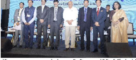
શ્રી ભૂપેન્દ્ર પટેલે જણાવ્યું કે, ગુજરાત દેશના જીઓપીઆ ઇ. ટેક, સ્માલ બિઝનેસ આઉટલુટમાં ૧૮૮૬ અને દેશની કુલ નિકાસમાં ૨૭ ટકાના યોગદાન સાથે અગ્રણ્ય છે. વડાપ્રધાનશ્રીના 'વિકસિત ભારત'ના વિઝનને સાકાર કરવા 'વિકસિત ગુજરાત @2047' ને રોડમૅપ તૈયાર કરનાર દેશનું પ્રથમ રાજ્ય છે. આ રોડમૅપ અંતર્ગત ૨૦૪૭ સુધીમાં રાજ્યના અર્થતંત્રને ૩.૫ ટ્રિલિયન યુએસ ડોલર સુધી લઈ જવાનો લક્ષ્યાંક