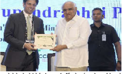
મુખ્યમંત્રીશ્રીએ વડાપ્રધાનશ્રીના નેતૃત્વ અને માગદર્શનમાં ગુજરાતની ઉવલપમેન્ટ જનીની પ્રભાવક પ્રસ્તુતિ કરતા કહ્યું કે, દ્રવીવંત નેતૃત્વ અને ઉવલપમેન્ટ માટેના કમિટમેન્ટથી કેટલી સીડ અને સ્કેલ સાથે સરકારને ડબલ ઉવલપમેન્ટ થઈ શકે તે ગુજરાતે દેશ અને દુનિયાને બતાવ્યું છે. શ્રી ભૂપેન્દ્ર પટેલે જણાવ્યું કે, ગુજરાત દેશના જીઓપીઆ ઇ. ટેક, સ્માલ બિઝનેસ આઉટલુટમાં ૧૮૮૬ અને દેશની કુલ નિકાસમાં ૨૭ ટકાના યોગદાન સાથે અગ્રણ્ય છે. વડાપ્રધાનશ્રીના 'વિકસિત ભારત'ના વિઝનને સાકાર કરવા 'વિકસિત ગુજરાત @2047' ને રોડમૅપ તૈયાર કરનાર દેશનું પ્રથમ રાજ્ય છે. આ રોડમૅપ અંતર્ગત ૨૦૪૭ સુધીમાં રાજ્યના અર્થતંત્રને ૩.૫ ટ્રિલિયન યુએસ ડોલર સુધી લઈ જવાનો લક્ષ્યાંક