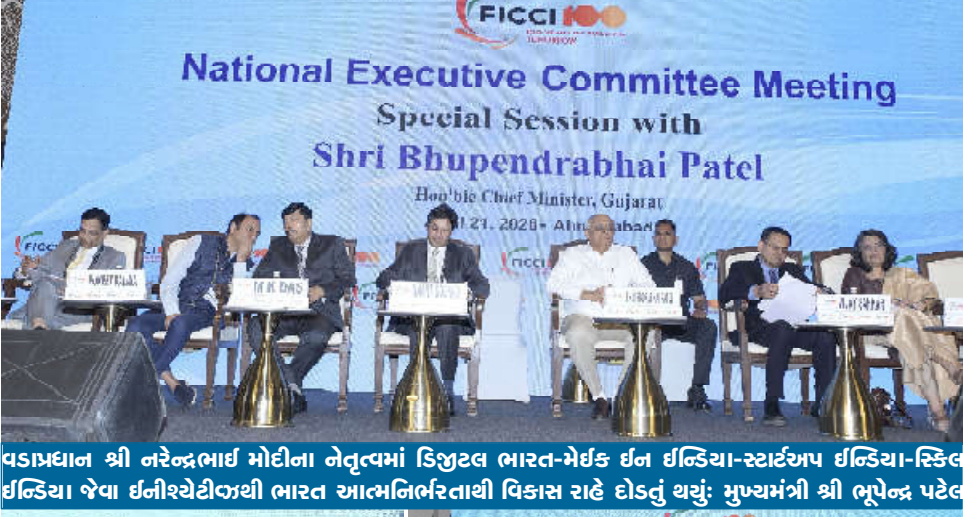
વડાપ્રધાન શ્રી નરેન્દ્રભાઈ મોદીના નેતૃત્વમાં ડિયુટલ ભારત-મેઈક ઇન ઇન્ડિયા-સ્ટાર્ટઅપ ઇન્ડિયા-સ્કિલ ઇન્ડિયા જેવા ઇનીશિયેટીવ્સથી ભારત આત્મનિર્ભરતાથી વિકાસ રાહે દોડતું થયું: મુખ્યમંત્રી શ્રી ભૂપેન્દ્ર પટેલ

કલમ્, મુખ્યમંત્રી શ્રી ભૂપેન્દ્ર પટેલે અમદાવાદમાં ફેરિશન આંદોલન ચેમ્બર્સ ઓફ કોમર્સ એન્ડ ઇન્ડસ્ટ્રી (FICCI)ની સ્થાપનાના ૧૦૦ વર્ષની ઉજવણીનો પ્રારંભ કરાવતાં કહ્યું કે, વડાપ્રધાન શ્રી નરેન્દ્રભાઈ મોદીના નેતૃત્વમાં દેશ આઝાદીની શતાબ્દી ઉજવવા તરફ આ ગળ વધી રહ્યા છે, ત્યારે FICCI ના ૧૦૦ વર્ષની ઉજવણી અને દેશનો આ અમુક મુદ્દા અંગે ફિક્કી માટે ડબલ બોના-ગા ઇ. મુખ્યમંત્રીશ્રીએ ફિક્કીની નેશનલ એક્ઝીક્યુટીવ કમિટીની મિટીંગમાં પ્રેરક સંબોધન કર્યું હતું. તેમણે દેશના સૌથી જુના, પ્રખ્યાત અને પ્રભાવશાળી ઉદ્યોગ મંચ તરીકે ફિક્કીની ૧૦૦ વર્ષની સફળ યાત્રાને નોંધપાત્ર સિમાચક ઘણાવી હતી. મુખ્યમંત્રીશ્રીએ કહ્યું કે વડાપ્રધાનશ્રી નરેન્દ્રભાઈ મોદીની વિઝનરી લિડરશીપમાં ફિક્કીને ભારત-મેઈક ઇન ઇન્ડિયા-સ્ટાર્ટઅપ ઇન્ડિયા-સ્કિલ ઇન્ડિયા જેવા ઇનીશિયેટીવ્સથી ભારત આત્મનિર્ભરતાથી વિશ્વ સહાયક દોડતું થયું છે તેમાં પણ ફિક્કીનો ઉલ્લેખનોય સહયોગ મળ્યો છે. મુખ્યમંત્રીશ્રીએ વડાપ્રધાનશ્રીના નેતૃત્વ અને માગદર્શનમાં ગુજરાતની ઉવલપમેન્ટ જનીની પ્રભાવક પ્રસ્તુતિ કરતા કહ્યું કે, દ્રવીવંત નેતૃત્વ અને ઉવલપમેન્ટ માટેના કમિટમેન્ટથી કેટલી સીડ અને સ્કેલ સાથે સરકારને ડબલ ઉવલપમેન્ટ થઈ શકે તે ગુજરાતે દેશ અને દુનિયાને બતાવ્યું છે. શ્રી ભૂપેન્દ્ર પટેલે જણાવ્યું કે, ગુજરાત દેશના જીઓપીઆ ઇ. ટેક, સ્માલ બિઝનેસ આઉટલુટમાં ૧૮૮૬ અને દેશની કુલ નિકાસમાં ૨૭ ટકાના યોગદાન સાથે અગ્રણ્ય છે. વડાપ્રધાનશ્રીના 'વિકસિત ભારત'ના વિઝનને સાકાર કરવા 'વિકસિત ગુજરાત @2047' ને રોડમૅપ તૈયાર કરનાર દેશનું પ્રથમ રાજ્ય છે. આ રોડમૅપ અંતર્ગત ૨૦૪૭ સુધીમાં રાજ્યના અર્થતંત્રને ૩.૫ ટ્રિલિયન યુએસ ડોલર સુધી લઈ જવાનો લક્ષ્યાંક