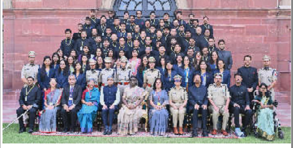
કલમ, ભારતીય રેલવેના પ્રોબેશનરી અધિકારીઓ અને સેન્ટ્રલ એન્જિનિયરિંગ સર્વિસ (રોડ્સ) ના આસિસ્ટન્ટ એક્ઝિક્યુટિવ એન્જિનિયરો (૨૦૨૧, ૨૦૨૨, ૨૦૨૩ અને ૨૦૨૪ બેચ) આજે (૨૦ એપ્રિલ, ૨૦૨૬) રાષ્ટ્રપતિ ભવન ખાતે ભારતના રાષ્ટ્રપતિ શ્રી મોદી સાથે મુલાકાત કરી. આ અવકાશમાં રાષ્ટ્રપતિએ કહ્યું કે તેઓ ભારતની વિકાસશીલના એક મહત્વપૂર્ણ તબક્કે જાહેર સેવામાં જોડાયા છે. રાષ્ટ્ર વિસ્તરિત ભારત બનાવવાના સમૂહિક કાર્યક્રમ સાથે આગળ વધી રહ્યું છે. ભારતીય રેલવે અને સેન્ટ્રલ એન્જિનિયરિંગ સર્વિસ (રોડ્સ) ના યુવા અધિકારીઓ તરીકે, તેઓ એવી ભૂમિકાઓમાં પ્રવેશ કરી રહ્યાં છે જે લાખો નાગરિકોના જીવન પર સીધી અસર કરે છે. તેમણે ભારતના વિકાસ પર સીધી અને ક્યમી અસર કરશે. રાષ્ટ્રપતિએ કહ્યું કે માળખાગત સુવિધાઓ અને પાયાં જે જોના પર આધુનિક રાષ્ટ્રોને નિર્માણમાં રહેલ અને હાલથી કેન્દ્ર પરિહરના નિયામકો નથી. તે આર્થિક વિસ્તરણ, સામાજિક સમાવેશ અને રાષ્ટ્રીય એકીકરણના વાહન છે, જેમને