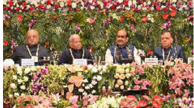
કમલમ્, લખનૌ ખાતે યાલી રહેલી ૮૬મી અખિલ ભારતીય પીકાસી અધિકારીઓની પરિષદ (AIPOC) ના બીજા દિવસનું નવું મુખ્ય વિષયો પરના વિચારવર્તનમાં સામેલ થયું.

૮૬મી અખિલ ભારતીય પીકાસી અધિકારીઓની પરિષદ (AIPOC) ના બીજા દિવસે એજન્ડા વિષયો પર વિસ્તૃત ચર્ચા