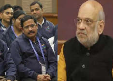
શ્રમ કરતા લોકોના નફામાં પણ ભાગીદારીનું નામ જ સહકારિતા છે

ખાતામાં પાછા જશે જે કિલોમીટર મુસાફરીની સંખ્યાના આધારે હશે. શ્રી શાહે જણાવ્યું હતું કે ભારત ટેક્સીનો ધ્યેય નફો કમાવવાનો નથી, અરણ્યક ડ્રાઈવરો સહકારીના માલિક છે. કેન્દ્રીય સહકારિતા મંત્રી શ્રી અમિત શાહે જણાવ્યું હતું કે ભારત ટેક્સીએ 'સાર્થકી દીદી' સુવિધાની કલ્પના કરી છે. ભારત ટેક્સીની 'સાર્થકી દીદી' સુવિધા મહિલા ડ્રાઈવરોને સશક્ત બનાવશે અને મહિલા મુસાફરો અને ડ્રાઈવરો બંનેની સલામતી સુનિશ્ચિત કરશે. તેમણે જણાવ્યું હતું કે આગામી દિવસોમાં ભારત ટેક્સી એપમાં 'સાર્થકી દીદી' નામથી જોવાઈશે અને ડ્રાઈવરોમાં આવશે, જેથી જ્યારે પણ એક પણ મહિલા મુસાફર હાજર હોય, ત્યારે તેને સ્વાભાવિક રીતે પ્રાથમિકતા મળે. શ્રી અમિત શાહે જણાવ્યું હતું કે ભારત ટેક્સીને લઘુત્તમ કાર્યક્ષમતા ના આધારે બેઝલાઈન કિલોમીટર દર સ્થાપિત કરીને કાર્ય કરશે. તેમણે જણાવ્યું હતું કે ભારત ટેક્સીનો આધાર દર ઓટોના ભાવ, પેટ્રોલ વપરાશ