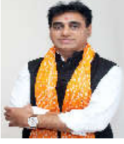
મેડિકલ કાઉન્સિલમાં પણ જાણ કરવામાં આવી હોવાનું તેમણે ઉમેર્યું હતું.

પાનસેરિયાએ સ્પષ્ટ જણાવ્યું કે આ યોજનાના નિયમો કે જેનું ઉદ્દેશ્ય કરનાર હોસ્પિટલો સામે કડક કાર્યવાહી કરવામાં આવે છે. છેલ્લા બે વર્ષમાં કુલ ૪૮ હોસ્પિટલોને સર્પેન્ડ કરવામાં આવી છે, જેમાંથી ૨૮ હોસ્પિટલનું સંસ્થાન હાલ પણ અમલમાં છે. જાનનગરની જે સીસીસી હોસ્પિટલના કિસ્સામાં રૂ. ૮.૬૯ લાખની પેનલ્ટી વસૂલવા ઉપરાંત જવાબદાર તબીબને યોજનામાંથી સર્પેન્ડ કરી