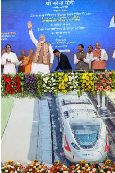
શ્રી નરેન્દ્ર મોદી

દેખાશે તેની ભવ્ય ઝલક પૂરી પાડે છે. સંકલિત પ્રણાલી શહેરની અંદરની મુસાફરી માટે મેટ્રો અને 'ટૂવીન સિટીઝ' ના વિઝનને વેગ આપવા માટે નમો ભારત ટૂંકાનો ઉપયોગ કરે છે. ડબલ-એન્જિન સરકારની કાર્યસંસ્કૃતિ પર પ્રકાશ પાડતા, પ્રધાનમંત્રીએ નોંધ્યું હતું કે પ્રોજેક્ટ્સ હવે અટકી રહેલા નથી. તેમણે ભારતીય જણાવ્યું હતું કે તેમની સરકાર જે કામનો શિલાન્યાસ કરે છે તે કામ પૂર્ણ કરે છે. આ સેવાઓના શિલાન્યાસ અને ઉદ્ઘાટન બંનેનું તેમણે વ્યક્તિગત રીતે નેતૃત્વ કર્યું છે. તેમની મુલાકાત દરમિયાન, પ્રધાનમંત્રીએ મેરઠ મેટ્રોમાં મુસાફરી કરી અને વિદ્યાર્થીઓ તથા મુસાફરો સાથે સંવાદ કર્યો. પ્રધાનમંત્રીએ આ પ્રોજેક્ટને 'નારી-શક્તિ' ના પ્રતીક તરીકે આવકાર્યો હતો, અને નોંધ્યું હતું કે મોટાભાગના ટ્રેન ઓપરેટરો અને સ્ટેશન કર્મચોરો સ્ટાફ મહિલાઓ છે. તેમણે દેશની પ્રથમ નમો ભારત રેલિવે રેલ સેવા બદલ ઉત્તર પ્રદેશના લોકોને અભિનંદન પાઠવ્યા હતા. મેરઠ સાથેના તેમના વિશેષ જોડાણને યાદ કરતા, પ્રધાનમંત્રીએ નોંધ્યું હતું કે ૨૦૧૪, ૨૦૧૯ અને ૨૦૨૪ માં તેમની રાષ્ટ્રીય ચૂંટણી પ્રયાનની શરૂઆત આ કોન્ટ્રાક્ટની પરતીપરથી થઈ હતી. તેમણે આ વિસ્તારના ખેડૂતો, કારીગરો અને ઉદ્યોગસાહસિકો ના સત્તા આશીર્વાદ બદલ આભાર માન્યો હતો. "૨૦૧૪ પહેલાં મેટ્રો સેવા માત્ર ૫ શહેરોમાં પહોંચી હતી, પરંતુ હવે ૨૫ થી વધુ શહેરોમાં મેટ્રો દોડી રહી છે, જે ભારતને વિશ્વની ત્રીજી સૌથી મોટું નેટવર્ક બનાવે છે", શ્રી મોદીએ નોંધ્યું હતું. "પ્રોજેક્ટની અંક વિશિષ્ટ