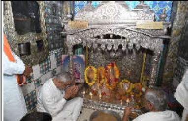
કલમ્, ભાજપ પ્રદેશ અધ્યક્ષ શ્રી જગદીશભાઈ વિશ્વકર્માએ આજે બનાસકાંઠાના અમરવાડા ખાતે શ્રી મહાભદ્ર વીર મહારાજના દર્શન કરી આશીર્વાદ મેળવ્યા હતાં અને શ્રી નાગરિકોની સુખકારી માટે પ્રાર્થના કરી હતી.