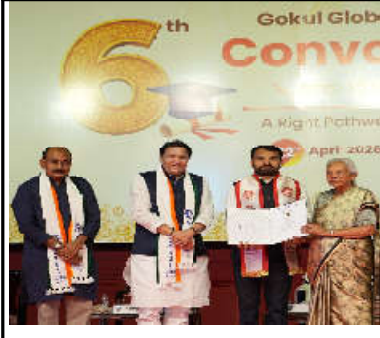
કલમ્, સિદ્ધપુર ખાતે ઉત્તર પ્રદેશ રાજ્યના મહામહિમ રાજ્યપાલશ્રીમતી આનંદીબેન પટેલજીના ગૈરવર્ણ્ય અધ્યક્ષસ્થાને ધારાસભ્યશ્રી ભલવંતસિંહ રાજપૂત અને ખોડલાધાના અધ્યક્ષ શ્રીમતી અનારબેન પટેલની પ્રેક્ષા ઉપસ્થિતિમાં ગોકુલ જ્ઞાન જ્ઞાન સુવિવર્સિટીનો 'છઠ્ઠો વાર્ષિક પદવીધન સમારોહ' ભવ્યતા અને ગૌરવ સાથે યોજાયો. આ અમસરે કુલ ૧,૨૦૩ પદવીઓ, ૪૨ ગોલ્ડ મેડલ અને ૪૨ સિલ્વર મેડલ એનાયત કરીને પ્રતિભાશાળી વિદ્યાર્થીઓને સન્માનિત કરવામાં આવ્યાં. મહામહિમ રાજ્યપાલશ્રીએ પોતાના પ્રેરણાદાયક સંબોધનમાં ઉચ્ચ શિક્ષણમાં ડિગ્રિલ અને ટેકનોલોજી અધ્યાપિક અભિયાન સાથે સંબંધિત, નવીનતા અને સ્વિકલ વલયને પ્રોત્સાહન આપવાની જરૂરિયાત પર ભાર મૂક્યો. તેમણે ગોકુલ જ્ઞાન સુવિવર્સિટીને NAAC માં 'બી' ગ્રેડ પ્રાપ્ત કરવા અને અભિનંદન પાઠવ્યા અને ભવિષ્યમાં વધુ ઉત્ક્રમ સિદ્ધિઓ માટે શુભેચ્છાઓ આપી. સાથે સાથે પદવીધન પ્રત્યે જાગૃતિને સંક્રમિત આપતા તેમના હસ્તે વૃક્ષાભિષેક કરીને હરિત અને સ્વચ્છ ભારતના સંકલ્પને વધુ મજબૂત બનાવ્યો. આ પ્રસંગે મહામહિમ રાજ્યપાલશ્રીએ ગૌરવકારક કેન્દ્રની મુલાકાત લઈ વ્યાં ચાલી રહેલી સંસ્કારસભર અને મૂલ્ય આધારિત વિદ્યાર્થીઓની નોંધ લીધી તેમની પ્રશંસા વ્યક્ત કરી. આ સંક્રમણમાં સંકેતરત્ન સંકલન સમજના સમગ્રી વિકાસ માટે કેટલું મહત્વપૂર્ણ છે તે પણ ઉજાગર કર્યું. ધારાસભ્યશ્રી ભલવંતસિંહ રાજપૂત જણાવ્યું કે પદવીધન મુગ એક અંતિમ લક્ષ્ય નથી પરંતુ પાઠવા પડતીની શરૂઆત છે. વિદ્યાર્થીઓએ પોતાના પ્રમાણિક પ્રયત્નોથી મેળવેલા જ્ઞાનોને ઉપયોગ સમાજ અને રાષ્ટ્રવિકાસમાં કરવો જોઈએ. તેમણે વિશ્વાસ વ્યક્ત કર્યો કે સુવર્ણની શક્તિ અને સિદ્ધિઓ 'રાષ્ટ્ર પ્રથમ' ના ભાવ સાથે વિકસિત ભારત @ 2047 ના નિર્માણમાં મક્કમ યોગદાન આપવો. આ ગૌરવપૂર્ણ સમારોહમાં શ્રી જયેશભાઈ પટેલ, શ્રી અર્જુનસિંહ રાજપૂત, વી.સી. - ડો. એમ. એસ. રાવ, રજીસ્ટાર - શ્રી ચેતનસિંહ, આ અવસરે સુવિવર્સિટીના તમામ કોલેજોના પ્રિન્સિપાલશ્રીઓ, પ્રોફેસરો, વિદ્યાર્થીઓ તેમજ વહીવટી સ્ટાફ સહિતના તમામ આગેવાનો અને કર્મચારીઓ ઉપસ્થિત રહ્યાં હતાં.