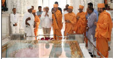
કલમ્, બોટદ જિલ્લાના પ્રવાસે પહોંચેલા રાજ્યના મુક્ત અને મક્કમ મુખ્યમંત્રીશ્રી ભુપેન્દ્રભાઈ પટેલે સાળંગમુર ખાતે BAPS સ્વામિનારાયણ મંદિરે દર્શન કરી સંતોના આશીર્વાદ પ્રાપ્ત કર્યાં હતાં.