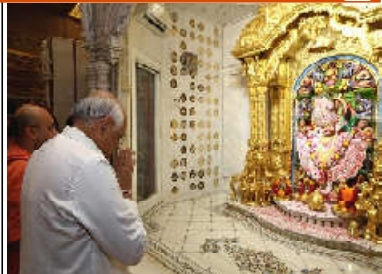
કલમ્, મુખ્યમંત્રીશ્રી ભુપેન્દ્રભાઈ પટેલે આજે ચાગાધામ સાળંગમુર ખાતે શ્રી કલ્યાણજીન દેવ હેલુમાનજી મંદિરે દર્શન કરી શ્રી નાગરિકોની સુખકારી માટે પ્રાર્થના કરી હતી.

સમિતિને મહત્વપૂર્ણ ગણાવી તેનું શ્રેય મોદીજીના વલિયાને આપ્યું. આજે કોંગ્રેસના રાષ્ટ્રીય અધ્યક્ષ શ્રી પ્રદેશ દ્વારા પ્રધાનમંત્રી શ્રી નરેન્દ્રભાઈ મોદી અંગે કલ્યાણમાં આવેલા નિર્દેશ પર તેમણે આક્રોશ વ્યક્ત કર્યો અને જણાવ્યું હતું કે પ્રધાનમંત્રીને અપમાન માત્ર વ્યક્તિગત અપમાન નથી, પરંતુ ૧૪૦ કરોડ ટ્રિલિયનની આર્થિક ક્ષમતાને યોગ્ય જવાબ આપવા અહલવાન કૃત્ય હતું. આગળ તેમણે જણાવ્યું હતું કે કોંગ્રેસે દેશ હિતના દરેક મહત્વપૂર્ણ નિર્ણયને વિરોધ કર્યો છે, જેમાં સંમ