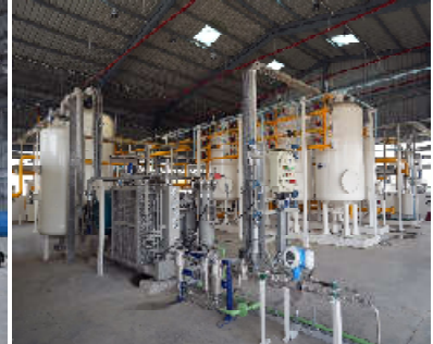
કમલમ્, ગાંધીનગર વડાપ્રધાન શ્રી નરેન્દ્ર મોદીના ‘વેસ્ટટુ વેલ્થ’, આત્મનિર્ભર ભારત અને હરિત ઊર્જાના વિઝનને સાકાર કરીને ગુજરાતનું વિસ્તૃત માંડલ વડે રાષ્ટ્રીય સ્તરે એક સફળ ઉદાહરણ તરીકે ઉભર્યું છે. સુખ્યમંત્રી શ્રી ભૂપેન્દ્ર પટેલના માંડલનું ત્રિકલિત કરવામાં આવેલ બનાસ બાયો સીએનજી પ્લાન્ટ માંડલને કેન્દ્રીય જાળવણિ મંત્રાલય અને કેન્દ્રીય સહકારીના વિભાગના સંપૂર્ણ પ્રયાસો થકી દેશના લગભગ ૧૫ રાજ્યો પોતાને ત્યાં અમલી કરવાની દિશામાં આગવળ વધી રહ્યા છે. બનાસ કરી દ્વારા વિસ્તૃત આ પ્રોજેક્ટ ગાયના છાણથી જ જૈવિક કચરાને સ્વચ્છ બનાવણ અને જૈવિક ખાતરમાં રૂપાંતરિત કરીને રાષ્ટ્રીય અર્થતંત્રની તસવીર દેખી રહ્યો છે.