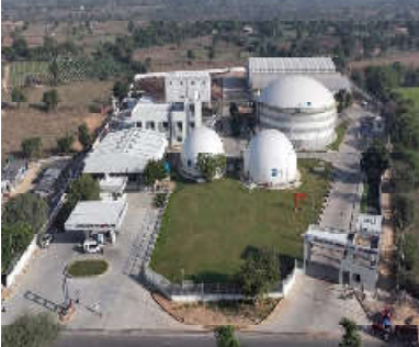
કમલમ્, ગાંધીનગર વડાપ્રધાન શ્રી નરેન્દ્ર મોદીના ‘વેસ્ટટુ વેલ્થ’, આત્મનિર્ભર ભારત અને હરિત ઊર્જાના વિઝનને સાકાર કરીને ગુજરાતનું વિસ્તૃત માંડલ વડે રાષ્ટ્રીય સ્તરે એક સફળ ઉદાહરણ તરીકે ઉભર્યું છે. સુખ્યમંત્રી શ્રી ભૂપેન્દ્ર પટેલના માંડલનું ત્રિકલિત કરવામાં આવેલ બનાસ બાયો સીએનજી પ્લાન્ટ માંડલને કેન્દ્રીય જાળવણિ મંત્રાલય અને કેન્દ્રીય સહકારીના વિભાગના સંપૂર્ણ પ્રયાસો થકી દેશના લગભગ ૧૫ રાજ્યો પોતાને ત્યાં અમલી કરવાની દિશામાં આગવળ વધી રહ્યા છે. બનાસ કરી દ્વારા વિસ્તૃત આ પ્રોજેક્ટ ગાયના છાણથી જ જૈવિક કચરાને સ્વચ્છ બનાવણ અને જૈવિક ખાતરમાં રૂપાંતરિત કરીને રાષ્ટ્રીય અર્થતંત્રની તસવીર દેખી રહ્યો છે.