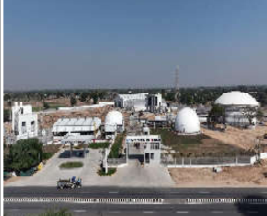
કમલમ્, ગાંધીનગર વડાપ્રધાન શ્રી નરેન્દ્ર મોદીના ‘વેસ્ટટુ વેલ્થ’, આત્મનિર્ભર ભારત અને હરિત ઊર્જાના વિઝનને સાકાર કરીને ગુજરાતનું વિસ્તૃત માંડલ વડે રાષ્ટ્રીય સ્તરે એક સફળ ઉદાહરણ તરીકે ઉભર્યું છે. સુખ્યમંત્રી શ્રી ભૂપેન્દ્ર પટેલના માંડલનું ત્રિકલિત કરવામાં આવેલ બનાસ બાયો સીએનજી પ્લાન્ટ માંડલને કેન્દ્રીય જાળવણિ મંત્રાલય અને કેન્દ્રીય સહકારીના વિભાગના સંપૂર્ણ પ્રયાસો થકી દેશના લગભગ ૧૫ રાજ્યો પોતાને ત્યાં અમલી કરવાની દિશામાં આગવળ વધી રહ્યા છે. બનાસ કરી દ્વારા વિસ્તૃત આ પ્રોજેક્ટ ગાયના છાણથી જ જૈવિક કચરાને સ્વચ્છ બનાવણ અને જૈવિક ખાતરમાં રૂપાંતરિત કરીને રાષ્ટ્રીય અર્થતંત્રની તસવીર દેખી રહ્યો છે.