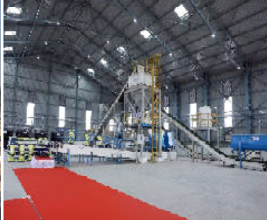
કમલમ્, ગાંધીનગર વડાપ્રધાન શ્રી નરેન્દ્ર મોદીના ‘વેસ્ટટુ વેલ્થ’, આત્મનિર્ભર ભારત અને હરિત ઊર્જાના વિઝનને સાકાર કરીને ગુજરાતનું વિસ્તૃત માંડલ વડે રાષ્ટ્રીય સ્તરે એક સફળ ઉદાહરણ તરીકે ઉભર્યું છે. સુખ્યમંત્રી શ્રી ભૂપેન્દ્ર પટેલના માંડલનું ત્રિકલિત કરવામાં આવેલ બનાસ બાયો સીએનજી પ્લાન્ટ માંડલને કેન્દ્રીય જાળવણિ મંત્રાલય અને કેન્દ્રીય સહકારીના વિભાગના સંપૂર્ણ પ્રયાસો થકી દેશના લગભગ ૧૫ રાજ્યો પોતાને ત્યાં અમલી કરવાની દિશામાં આગવળ વધી રહ્યા છે. બનાસ કરી દ્વારા વિસ્તૃત આ પ્રોજેક્ટ ગાયના છાણથી જ જૈવિક કચરાને સ્વચ્છ બનાવણ અને જૈવિક ખાતરમાં રૂપાંતરિત કરીને રાષ્ટ્રીય અર્થતંત્રની તસવીર દેખી રહ્યો છે.