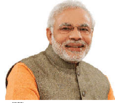
કમલમ્, વિસ્તૃત ગુજરાતથી વિસ્તૃત ભારતના સંકલ્પને સાકાર કરવાના મંત્ર સાથે રાજ્યના વડાપ્રધાન શ્રી નરેન્દ્રભાઈ મોદી આગામી ૩૧ માર્ચ, ૨૦૨૨ ના રોજ ગુજરાતની મુલાકાતે આવી રાહ છે. આ મુલાકાત દરમિયાન તેઓ અમદાવાદના સાણંદ ખાતેથી ગુજરાત ઓઈલગિક્સ વિકાસ નિગમ (GIDC) દ્વારા સંચય થયેલા ૨૭૧.૨૦ કરોડના વિવિધ વિકાસલક્ષી પ્રોજેક્ટ્સનું લોકાર્પણ કરશે. અમદાવાદના સાણંદ ખાતેના અંદાજે ૨,૦૫૬ હેક્ટરમાં ફેલાયેલી ઓઈલગિક્સ વસાહત આજ સુધી કમ્પ્લેટ, ઓટોમોબાઈલ અને કાર માસુલિક્સ જેવા ઘણાં ટૂંક ઉદ્યોગોનું હબ બની છે. અહીં ૧,૧૫૦ થી વધુ કાર્યકર્તાઓ રહેવા માટેના દરમિયાન આ વિસ્તારમાં ભરાતા વસાહતી માણીની ગંભીર સમસ્યાના કારણે નીતિરણ માટે GIDC દ્વારા બેમહત્વકારી પ્રોજેક્ટ્સ પૂર્ણ કરવામાં આવ્યા છે, જેમાં પૂર્વ અને પશ્ચિમ ડેઈન પ્રોજેક્ટ અંતર્ગત વસાહતની બંને બાજુએ ૧૮.૭૧ કી.મી. લાંબી RCC સ્ટોમ વોટર ડ્રેઈન બનાવવામાં આવી છે,

આ પ્રોજેક્ટ્સથી સાણંદ વસાહત હવે 'ઝીરો વોટર લોગિંગ' ઝોન બનશે