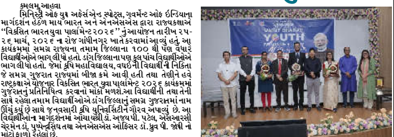
કમલમ્, ગ્રામીણ સુવિકાસ મિનિસ્ટ્રી હેઠળે યુવક અહેમદ એન. સ્પોર્ટ્સ, ગવર્મેન્ટ ઓફ ઈન્ડિયાના માર્ગદર્શન હેઠળે માય ભારત અને એન.એસ.એસ. દ્વારા રાજ્યકક્ષાએ 'વિકસિત ભારત યુવા પલામિન્ટ ૨૦૨૬' નું આયોજન નાણીય ૨૫-૨૬ માર્ચ, ૨૦૨૬ ને રોજ ગોંધીનગર ખાતે કરવામાં આવ્યું હતું. આ કાર્યક્રમમાં સમગ્ર રાજ્યના તમામ જિલ્લાના ૧૦૦ થી વધુ વધુ વિદ્યાર્થીઓએ ભાગ લીધો હતો. ડાંગ જિલ્લાના પૂર્ણ કુલ પાંચ વિદ્યાર્થીઓએ ભાગ લીધો હતો. જેમાં કૃષિ મહાવિદ્યાલય, વઘઈની વિદ્યાર્થીની નિહિતા જે સમગ્ર ગુજરાત રાજ્યમાં બીજા ક્રમે આવી હતી તથા તેણીને હવે રાજ્યકક્ષાએ યોજનાર નિકિતિ ભારત યુવા પલામિન્ટ ૨૦૨૬ કાર્યક્રમમાં ગુજરાતનું પ્રતિનિધિત્વ કરવાનો મોકલો મળ્યો. આ વિદ્યાર્થીની તથા તેની સાથે રહેલા તમામ વિદ્યાર્થીઓએ ડાંગ જિલ્લાનું સમગ્ર ગુજરાતમાં નામ ઊંચું કર્યું છે સાથે જ નવસારી કૃષિ યુનિવર્સિટીને ગૌરવ અપાવ્યું છે. આ વિદ્યાર્થીઓને માર્ગદર્શનમાં આચાર્યશ્રી ડા. અજય પી. પટેલ, એસ.આર.સી. રેલવે સેન્ટ્રલ ડા. પુષ્પેન્દ્રિય તથા એન.એસ.એસ. ઓફિસર ડા. કુવુ પી. જોષી નો મોટો ફાળો રહેલો છે.