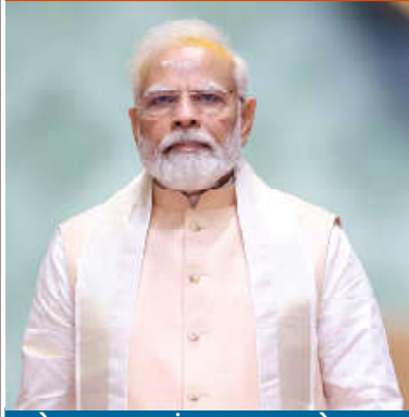
એકલા અમદાવાદમાં જ રૂ. ૪,૬૪૦ કરોડના ૩૨ પ્રોજેક્ટ્સનું થશે લોકાર્પણ અને ખાતમુહૂર્ત