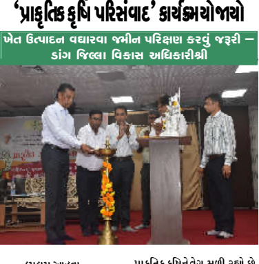
ખેત દિવ્યાદન વધારવા જમીન પરિસ્થિતિ કરવું જરૂરી - ડાંગ જિલ્લા વિકાસ અધિકારીશ્રી

કમલમ્, ડાંગ જિલ્લાના કૃષિ વિજ્ઞાન કેન્દ્ર વઘઈ ખાતે જિલ્લા વિકાસ અધિકારી શ્રી કે.એસ.વસવાના અધ્યક્ષ સ્થાને પ્રાકૃતિક કૃષિ પરિસંવાદ કાર્યક્રમ યોજાયો હતો. આ કાર્યક્રમમાં ૫૦૦ થી વધુ પ્રગતિશીલ ખેડૂતો અને ગ્રામજનને ઉત્સાહભરે ભાગ લીધો હતો. આ પ્રસંગે કાર્યક્રમના અધ્યક્ષ ડાંગ જિલ્લા વિકાસ અધિકારી શ્રી કે.એસ.વસવાએ જણાવ્યું હતું કે, સરકાર છેવાડાના માનવી સુધી કલ્યાણકારી યોજનાઓના લાભ પહોંચાડવા માટે પરિણામ લક્ષી પ્રયાસ કરે છે. ત્યારે પ્રાકૃતિક કૃષિને વ્યાપ વધારવા મહત્તમ સરકારી યોજનાઓનો લાભ લેવા ખેડૂતોને અનુરોધ કર્યો હતો. આ સાથે જ ખેડૂતોની ઓછી જમીનમાં ઉત્પાદન વધારવા માટે જમીન પરિવર્ણ કરવા સુચન કર્યું હતું. વધુમાં તેમણે ઉમેર્યું કે, રાજ્યપાલ શ્રી આચાર્ય દેવવ્રતજીના માર્ગદર્શન હેઠળ, ત્યારે આવાનો પેટીના સ્વાસ્થ્ય અને જમીનની કૃષ્ણભૂત જાળવવા માટે ડાંગ જિલ્લાના પ્રત્યેક ખેડૂતને વેજાનિક સમગ્ર કૃષિની સ્વયં પ્રાકૃતિક ખેતી અપનાવીને અન્ય ખેડૂતોને પણ જાગૃત કરીને અભિવાદ્ય છે.