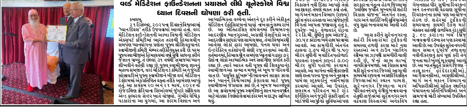
વર્લ્ડ મેડિટેશન કે કમિટી અને યુંગ્વે સોસાયટીએ પૂજ્ય સ્વામીજીને લીબ વર્લ્ડ મેડિટેશન કે ફોરમમાં આમંત્રિત કર્યા

કમલમ્, ૨૧ ડિસેમ્બર, ૨૦૨૫ના દિવસને વિશ્વભ્રમમાં 'ધ્યાન દિવસ' તરીકે ઉજવવામાં આવ્યો હતો. વર્લ્ડ મેડિટેશન ફાઉન્ડેશનની આખા વિશ્વની મેડિટેશન એક્સપર્ટ કમિટીમાં ભારત તરફથી હિમાલયીન સમપલ ધ્યાનયોગના પ્રણેતા પૂજ્ય શ્રી શિવકૃપાનંદ સ્વામીજીની કમિટી મેમ્બર તરીકે નિયુક્ત કરી છે. પરમ પૂજ્ય સ્વામીજીને હિમાલયમાં વર્ષ સુધી સાધના કરીને જ્ઞાન પ્રાપ્તિ, તે ઈશ્વર ૩૧ વર્ષથી સમગ્રજાતમાં ધ્યાન શીખાવતી વચ્ચે રહ્યા છે. પૂજ્ય સ્વામીજીના જ્ઞાનનું મહત્વ સમજીને, વર્લ્ડ મેડિટેશન કે કમિટી અને યુંગ્વે સોસાયટીએ પૂજ્ય સ્વામીજીને બીજા વર્લ્ડ મેડિટેશન કે ફોરમમાં એકામિતિ વક્તા તરીકે આમંત્રણ આપ્યું હતું. આ કાર્યક્રમ ૨૦ અને ૨૧ માર્ચ, ૨૦૨૬ ને રોજ દક્ષિણ ઈન્ડિયાના સિઆમમાં જૂંટો સાંશિલ્ય એન્ડ સ્પોર્ટ્સ સેન્ટર ખાતે યોજાયો. ગંભીર વૈદિક પદકારોના આ યુગમાં, આ ફોરમ વિકાસ અને આધ્યાત્મિકતા વચ્ચેના અંતરને દૂર કરીને એકીકૃત મેડિટેશન ઈકોસિસ્ટમનો પાયો નામ વગેરે વિશ્વરાષ્ટ્રે આ આંતરરાષ્ટ્રીય સંમેલનમાં વિશ્વભ્રમના આદરણીય ધ્યાનયુગનો, અગ્રણી વેજાનિકો અને આદરણીય સાધકો પણ સામેલ થયા. તેમાં વિશ્વભ્રમની આવેલા લોકો દ્વારા ભાષણો, પેનલ ચર્ચા અને ઈન્ટરેક્ટિવ વર્કશોપની શ્રીશ્રી રજૂ કરવામાં આવી. વર્તમાનમાં, હિમાલયીન સમ્પૂર્ણ ધ્યાનયોગ દ્વારા ૭૨ દેશો ના લોકો આધ્યાત્મિક અને સર્વાંગી પ્રગતિ કરી શકાશે. ત્યારે ભારત વતી પૂર્ણ શ્રી યોજનાનાં સ્વામીજીને આ સન્માન મળવું એ ખૂબ જ શોભાળીય વાત છે. 'વસુધેવ કુટુંબની ભાવના'ને લેવાવા માટે પૂર્ણ સ્વામીજીએ જે પ્રયાસ કર્યા છે, તે મૂળ જ મહત્વનું છે. આ કાર્યક્રમમાં પૂર્ણ સ્વામીજીનું જ્ઞાન માનવજાતે માટે યોગ્ય નિષ્ણતાવલિમાં ફોરમને મદદરૂપ સાબિત થયું.