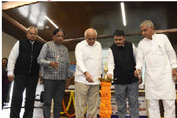
ઉત્તર ગુજરાતના ૭ જિલ્લાઓના વિવિધ તાલુકાઓના ૨૬૦થી વધુ ગામોના સરપંચો સહભાગી થયા

આ પ્રસંગે પંચાયત અને ગ્રામ ગુદ નિર્માણ મંત્રી શ્રી રૂપિણી ભાઈ પટેલે જણાવ્યું હતું કે, ગામડાના નાગરિકોને શહેરની કલ્યાણ સાથે જોડવા તેમજ શહેર જેવી આધુનિક સુવિધાઓ ગામમાં આપી શકે 'આદર્શ' ગામ બનાવવાનું ભૌતિક કાર્ય આપ સરપંચોએ કરવાનું છે. આપણા શ્રી વડાપ્રધાનશ્રી મોદી જ્યારે ભારતના વડાપ્રધાન બન્યા ત્યારે તેમણે ગામ વિકાસના હિતમાં ૭૦ ટકા નાણાં પંચની ગ્રામ વાવરનો અધિકાર સરપંચોને આપવાનો મહત્વનો નિર્ણય કર્યો છે. જેથી સરપંચ અને ગામજનો સાથે મળીને જિલ્લે ઉત્કલ વસ્તુત્વાત નેતૃત્વમાં સર્વોચ્ચ ગામડાઓમાં સુવિધાઓ આપી શકે. ગામના સરપંચ ગામના નાગરિકો સાથે મળીને નક્કી કરી શકે. ગામમાં ક્યાં સરે ભાવળિયા છે, ક્યાં પાણીની સગવડ આપવાની બાંધે છે, ક્યાં લાઈટ, ક્યાં ગરમી